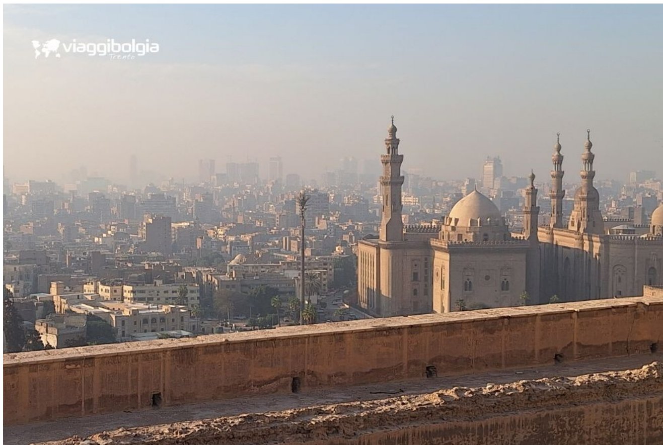
Il Cairo storico, proclamato Patrimonio UNESCO nel 1979

Visita alla Cittadella di Salah El Din , alla celebre Moschea di Alabastro e passeggiata lungo la scenografica Moez Street , tra palazzi, corti e vicoli fino al vivace Mercato di Khan el-Khalili .