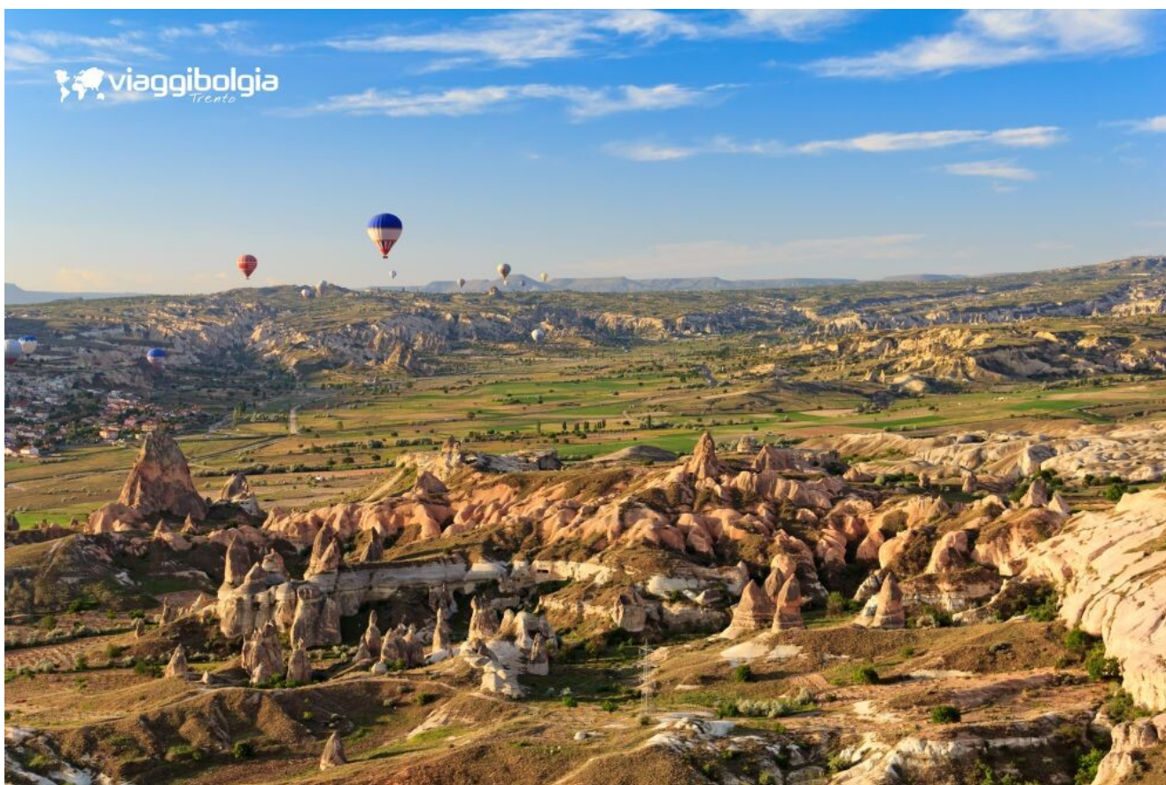
Cappadocia, paesaggi tufacei e camini delle fate modellati dall'erosione.

Si prosegue verso Paşabağ , la Valle del Monaco , dove le rocce somigliano a enormi funghi, e quindi nella Valle di Avcılar . Al tramonto passeggiata nella Valle Rosa , quando il tufo assume tonalità calde e molto particolari. Pranzo in ristorante locale in corso di visite. Cena e pernottamento.