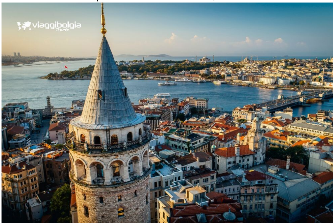
Istanbul e il Bosforo, confine naturale tra Europa e Asia.

All'arrivo incontro con la guida locale e prima panoramica della città che termina al porto. Navigazione in battello privato sul Bosforo, lo stretto che si estende tra il Mar Nero e il Mar di Marmara e che separa Europa e Asia. Visita al Mercato delle Spezie e trasferimento in hotel. Cena e pernottamento in hotel.