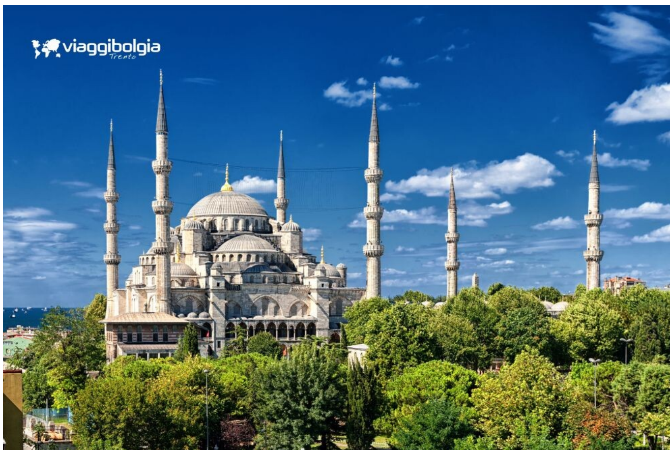
La Moschea Blu, tra i migliori esempi di architettura ottomana.

Pranzo in ristorante locale con piatti tipici in corso di visita. Cena libera e pernottamento.