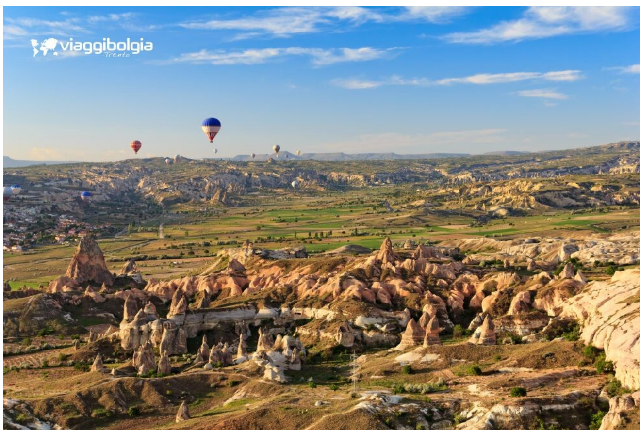
Cappadocia, paesaggi tufacei e camini delle fate modellati dall'erosione.

Si prosegue verso Paşabağ , la Valle del Monaco , dove le rocce somigliano a enormi funghi, e quindi nella Valle di Avcılar . Al tramonto passeggiata nella Valle Rosa , quando il tufo assume tonalità calde e molto particolari. Pranzo in ristorante locale in corso di visite. Cena e pernottamento.