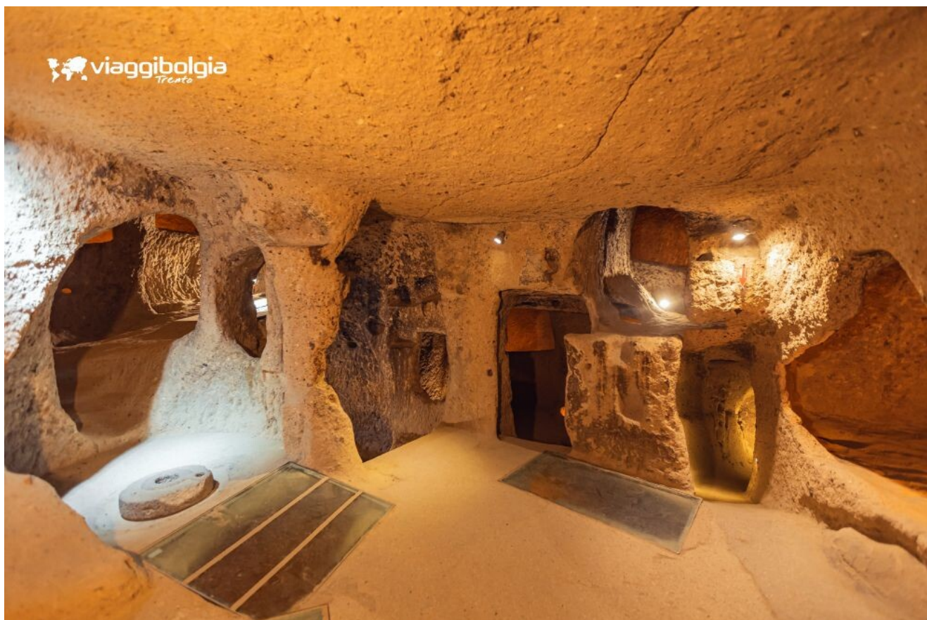
Kaymakli, città sotterranea scavata nel tufo: tunnel, ambienti e passaggi su più livelli.

A seguire visita di Uçhisar , un insediamento fortezza scavato in un affioramento roccioso, il più alto della Cappadocia , arroccato sulla sommità di un'altura. Pranzo in ristorante locale in corso di visite. Cena e pernottamento.