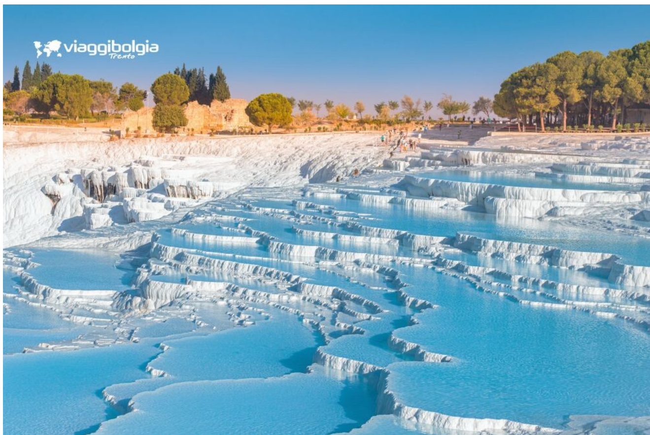
Pamukkale, terrazze di travertino create dalle acque termali ricche di minerali.

Visita di Hierapolis , città termale di grande importanza in età antica grazie alle proprietà terapeutiche delle acque. Trasferimento in hotel a Denizli , cena e pernottamento.