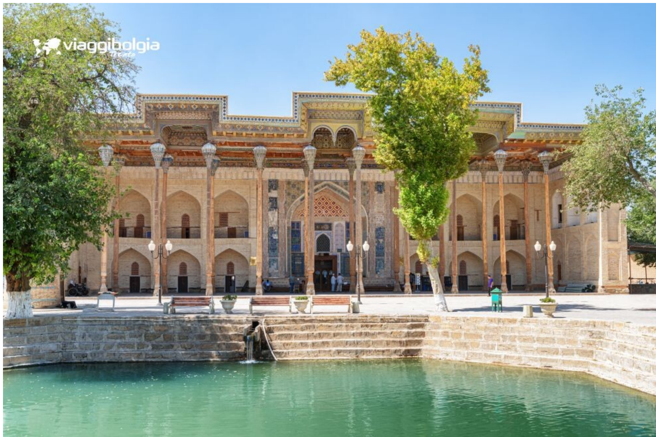
Bukhara - Moschea Bolo Hauz