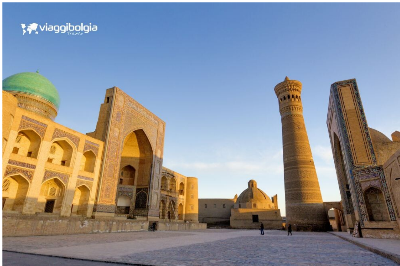
Bukhara - Minareto Kalon