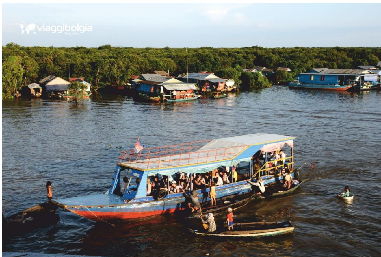
Tonlé Sap e i villaggi galleggianti di pescatori

Terminata l'escursione, trasferimento in aeroporto per il volo diretto a Ho Chi Minh . Arrivo in Vietnam, incontro con la guida e trasferimento in hotel per la cena e il pernottamento.