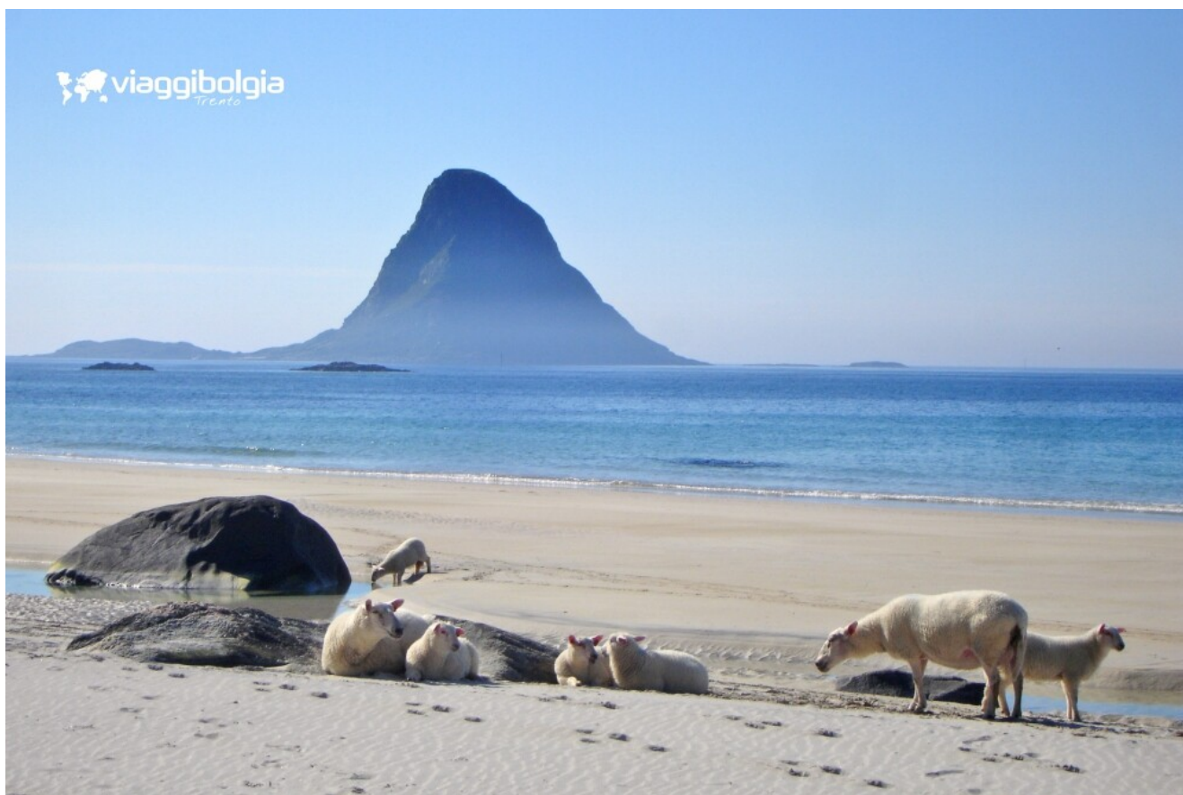
Spiaggia di Bleik sulle isole Vesterålen

Proseguimento per Harstad . Cena e pernottamento in hotel.