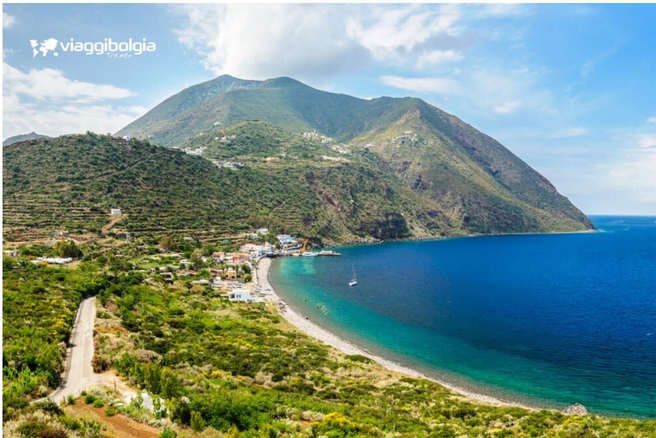
Filicudi, una baia tranquilla tra macchia mediterranea e mare turchese.