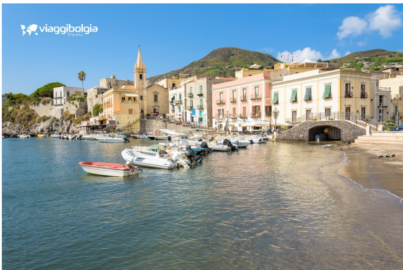
Lipari, scorcio del porticciolo e del centro storico tra case colorate e barche.