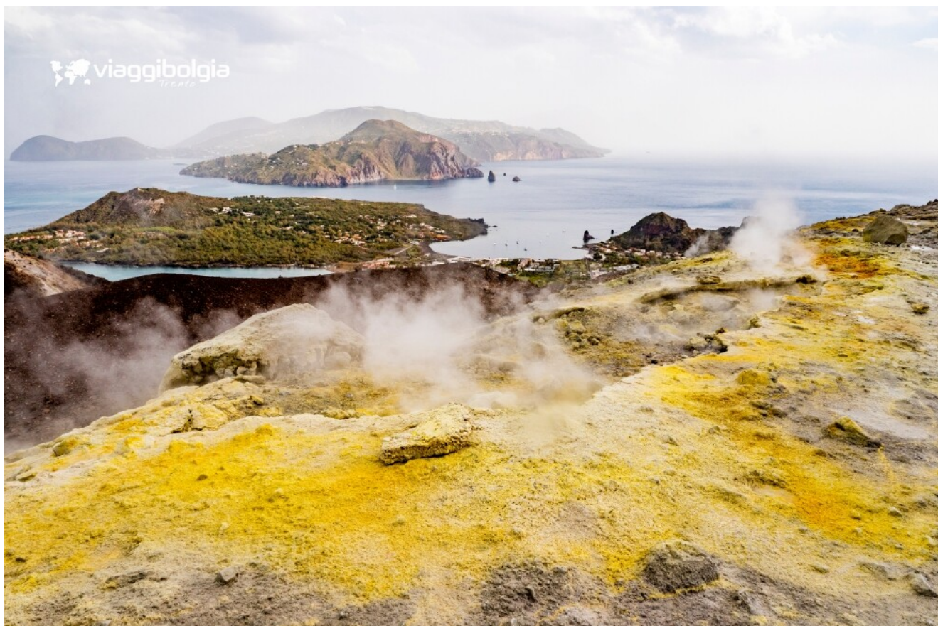
Vulcano, fumarole e colori minerali sul cratere, con vista panoramica sull'arcipelago.