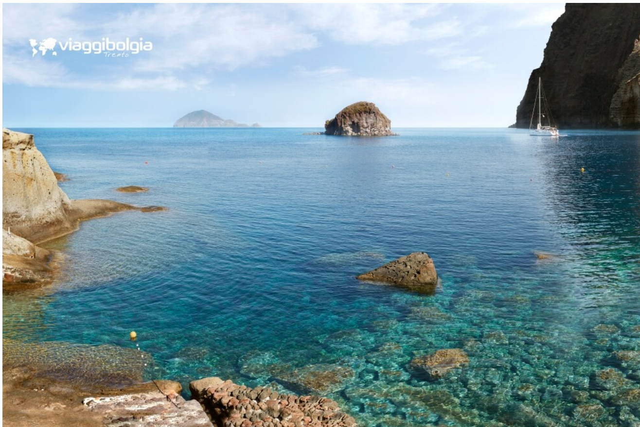
Baia di Pollara, acqua trasparente e scogli vulcanici in uno degli angoli più iconici delle Isole Eolie.