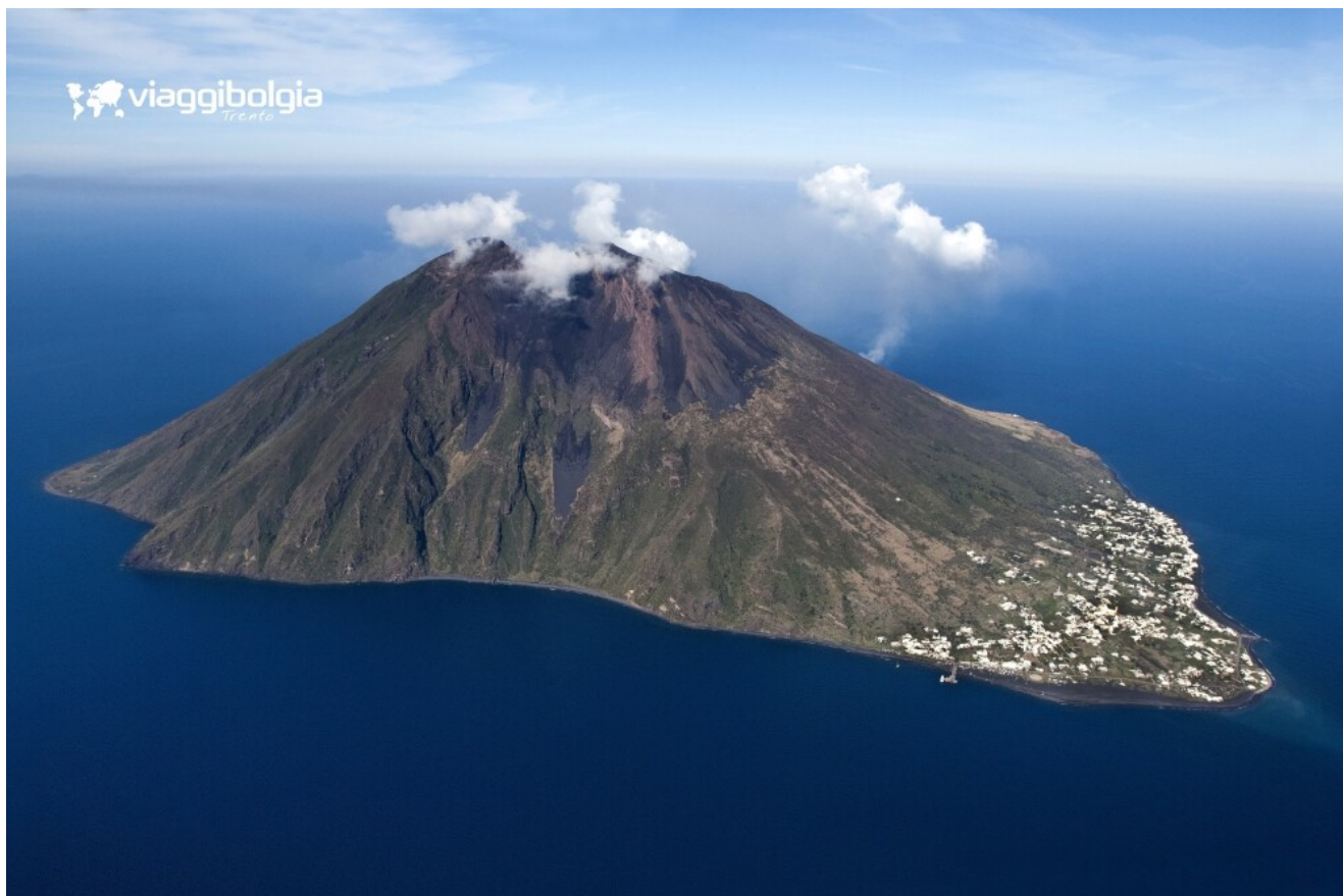
Stromboli, il profilo del vulcano visto dal mare, con il cratere fumante.