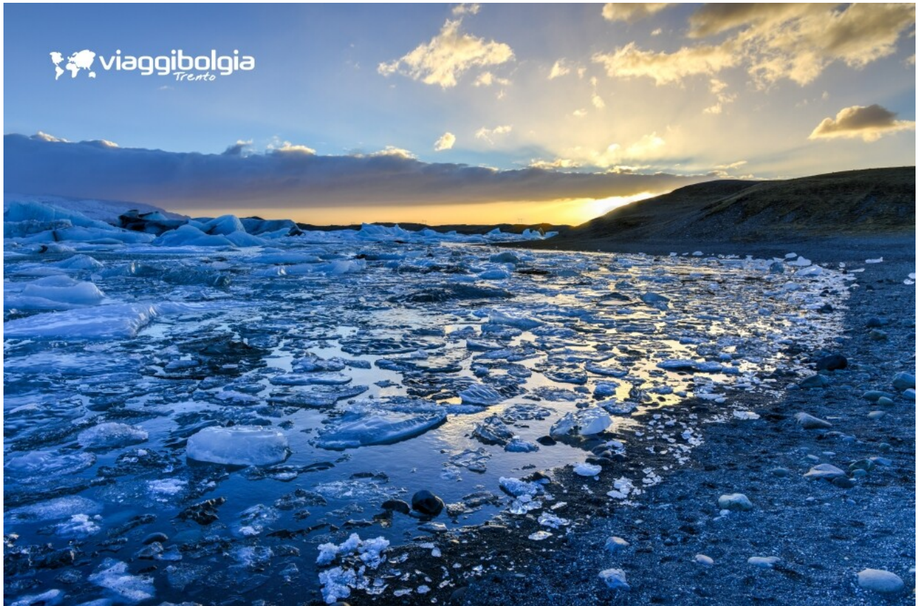
Laguna glaciale di Jökulsárlón