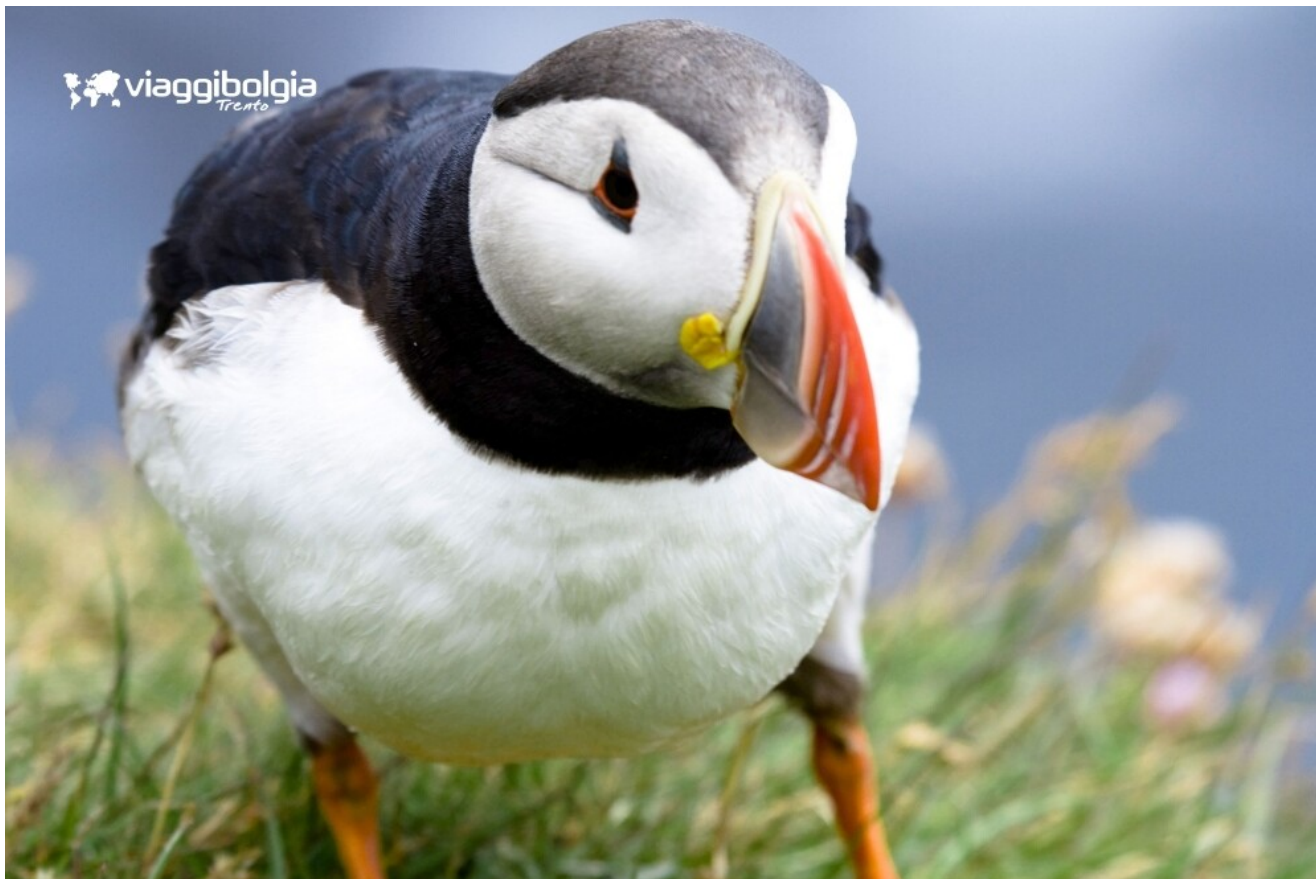
Pulcinella di mare