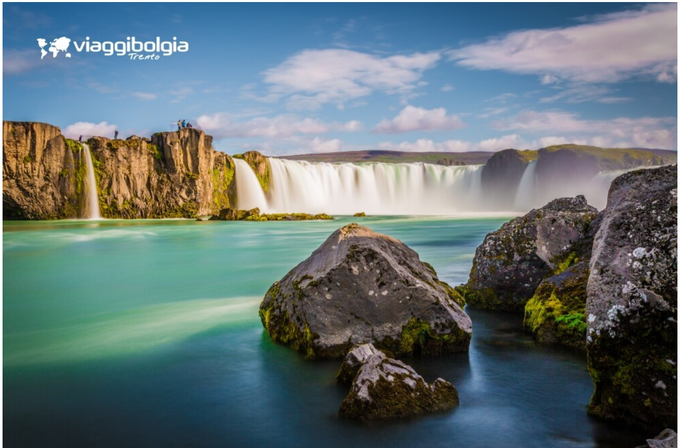
Goðafoss, cascata degli dei