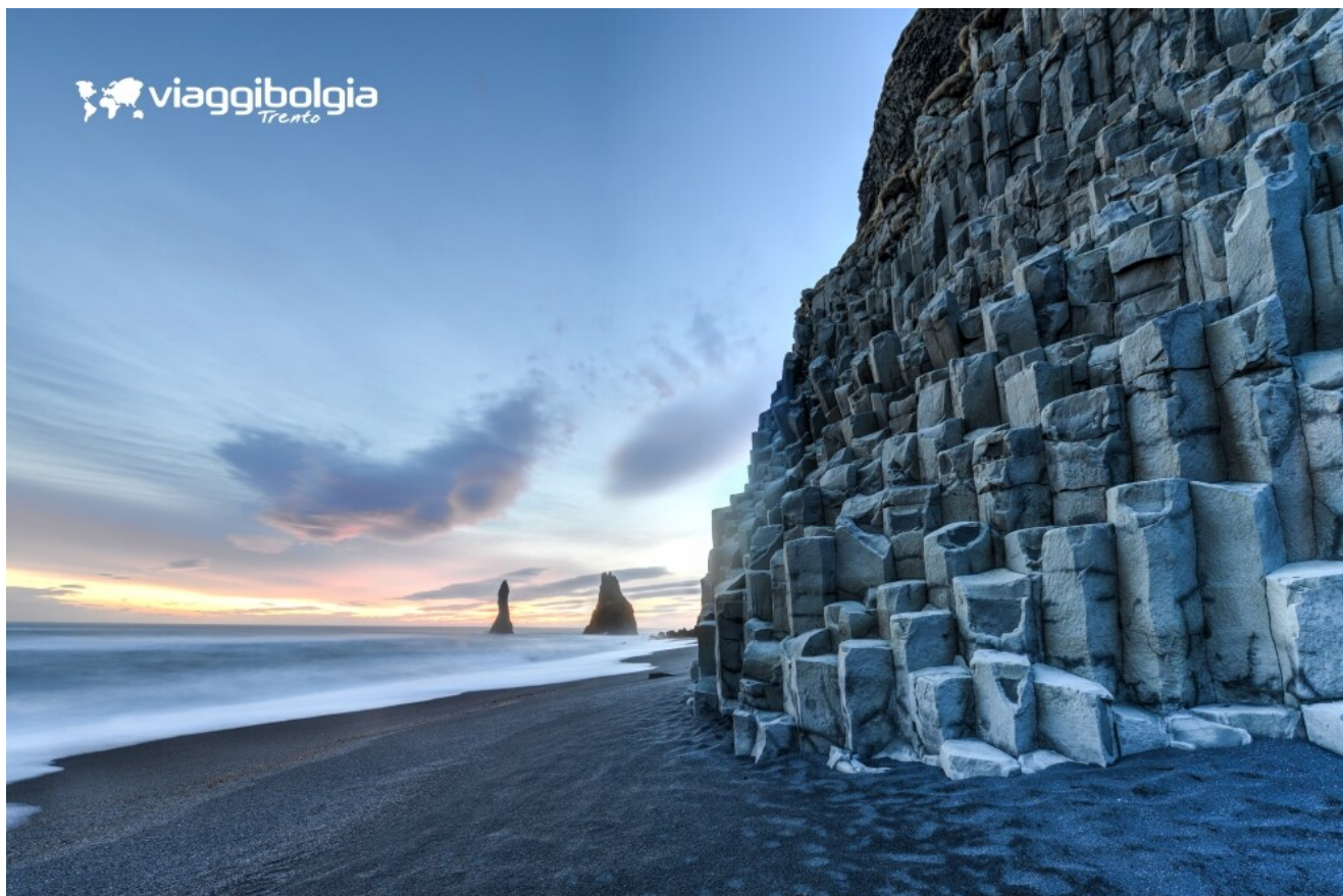
La spiaggia nera di Reynisfjara