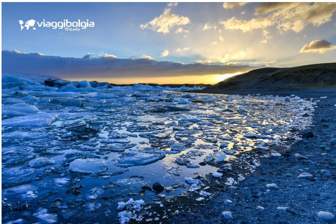
Laguna glaciale di Jökulsárlón