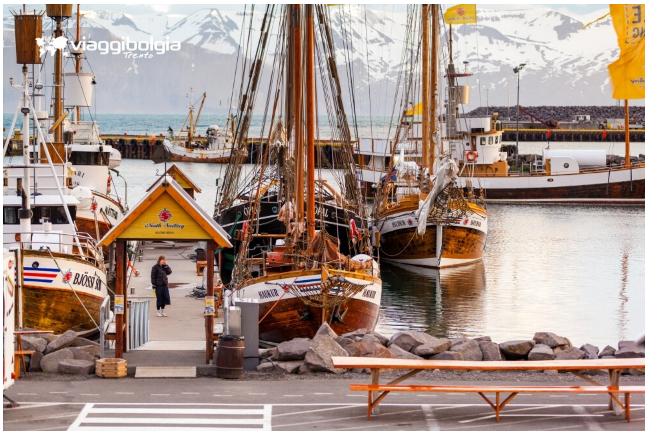
Porto di Húsavík