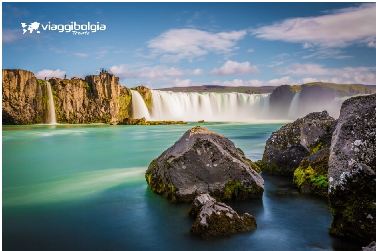
Gullfoss, la “cascata d’oro”