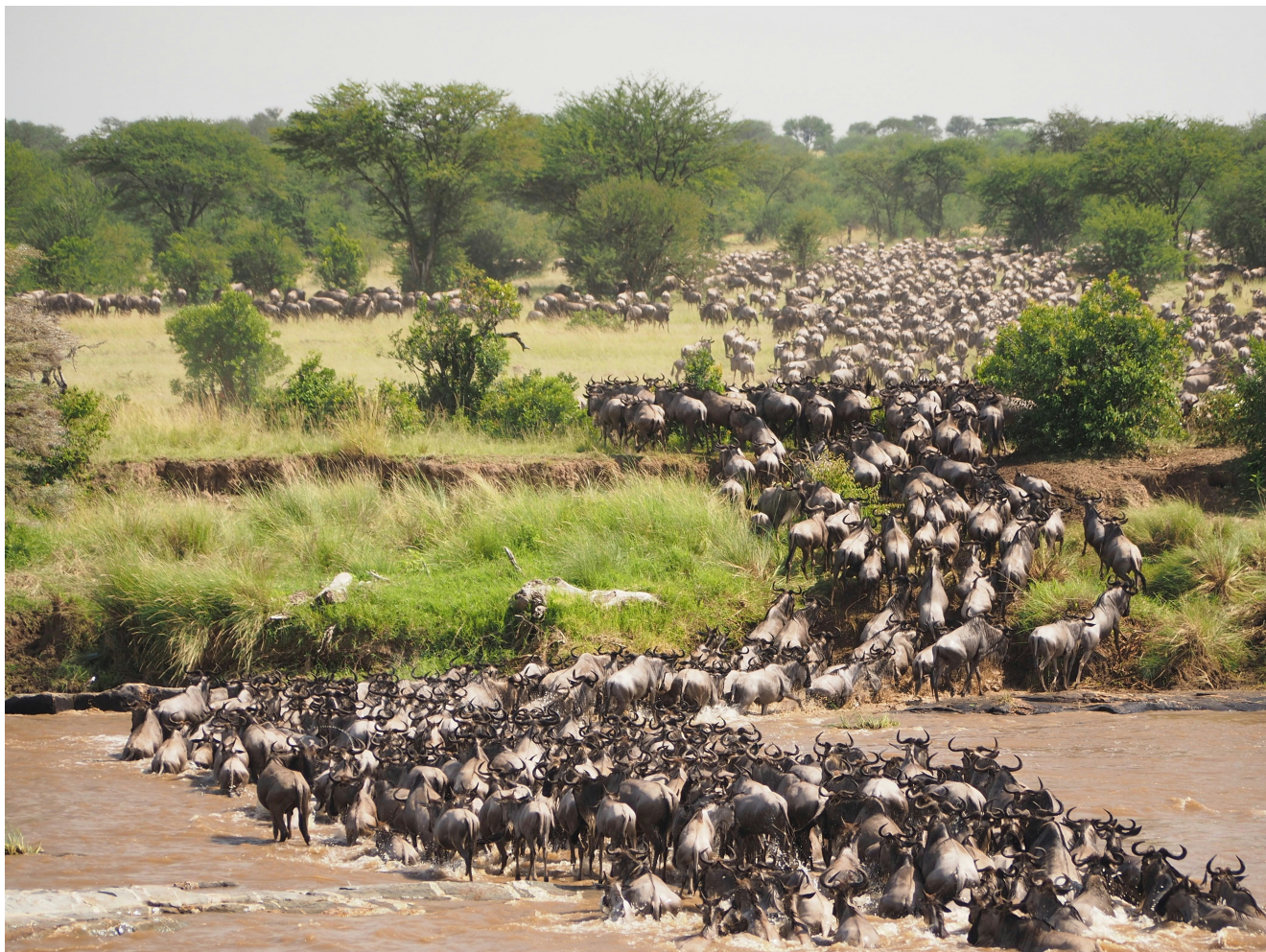
La Grande migrazione - un evento stagionale unico al mondo, che coinvolge più di 1 milione di animali