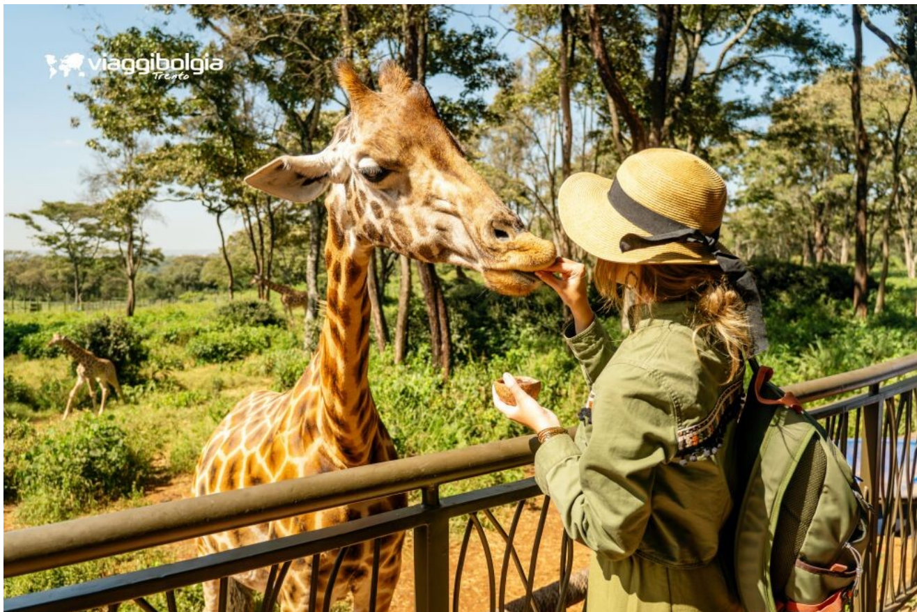
Nairobi Giraffe Centre - centro di conservazione della giraffa di Rothschild Solio Game Reserve