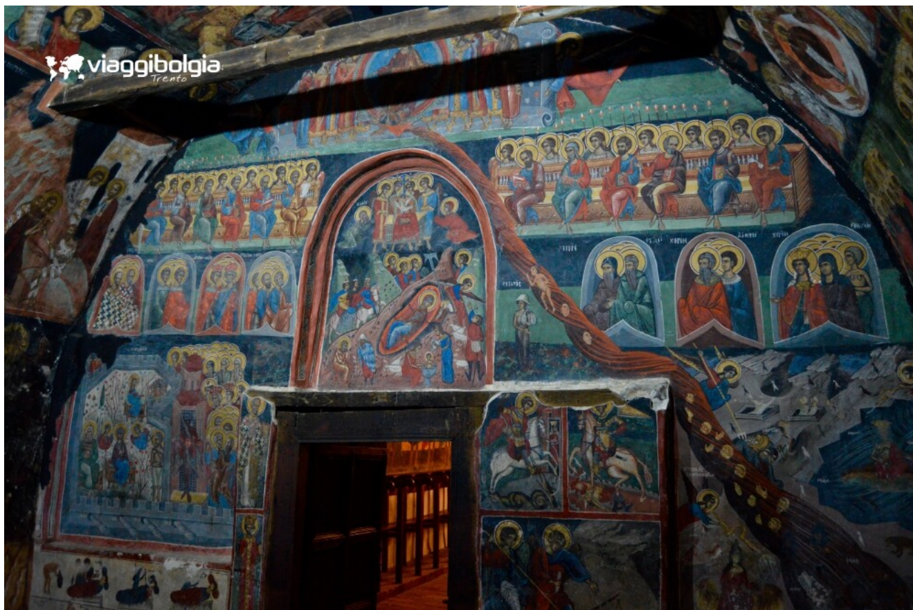
Arbanassi: la Chiesa della Natività, nota per i magnifici affreschi interni.