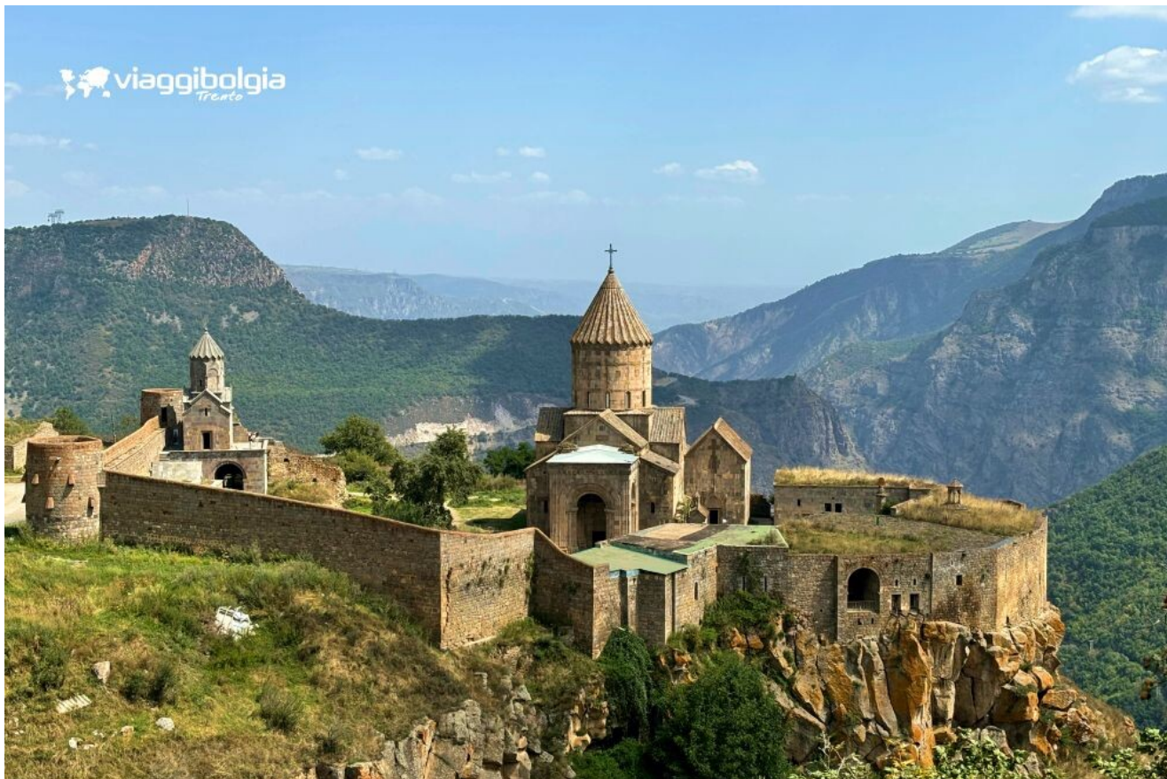
Monastero di Tatev - in posizione suggestiva a picco sulla gola del fiume Vorotan