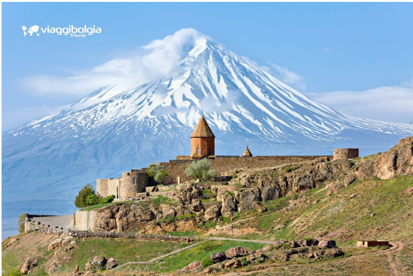
Khor Virap - ai piedi dell'Ararat, Il Monastero Armeno per eccellenza