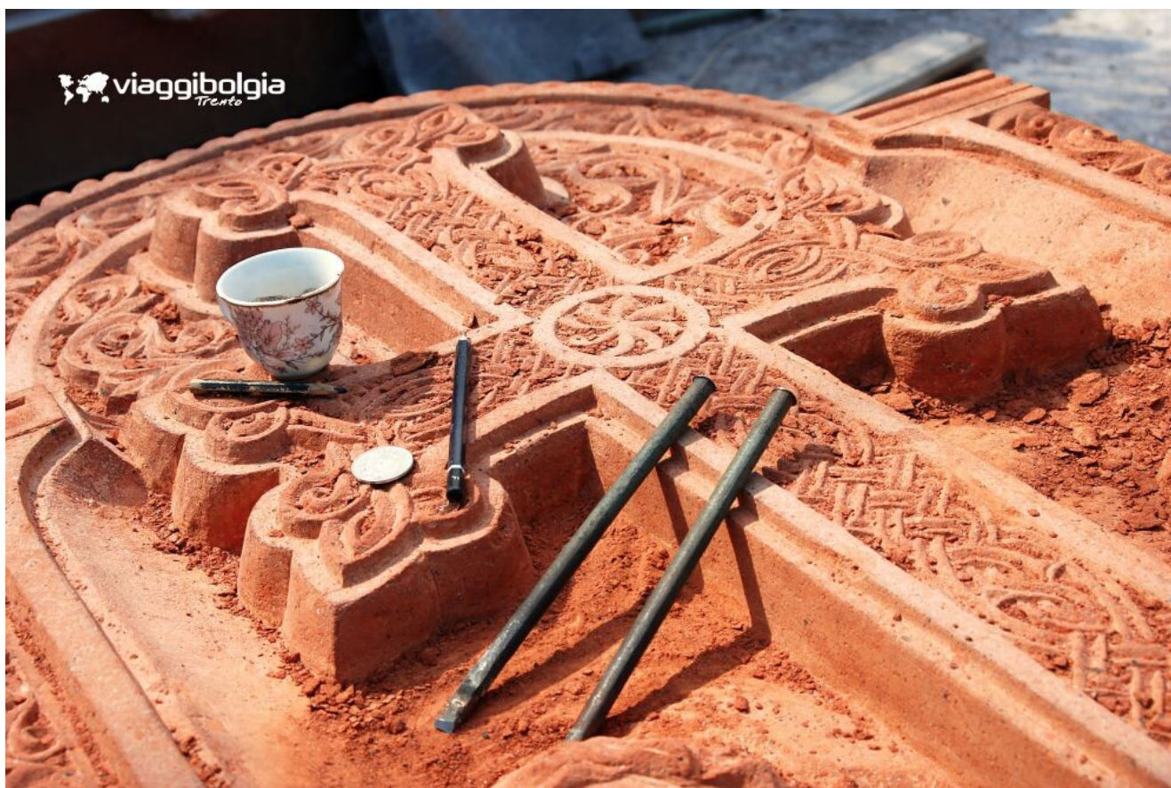
Khachkar - la scultura simbolo della tradizione funeraria e celebrativa armena

Arrivo in serata a Dzoraget , sistemazione in un bellissimo hotel sulle rive del fiume Debed, cena e pernottamento.