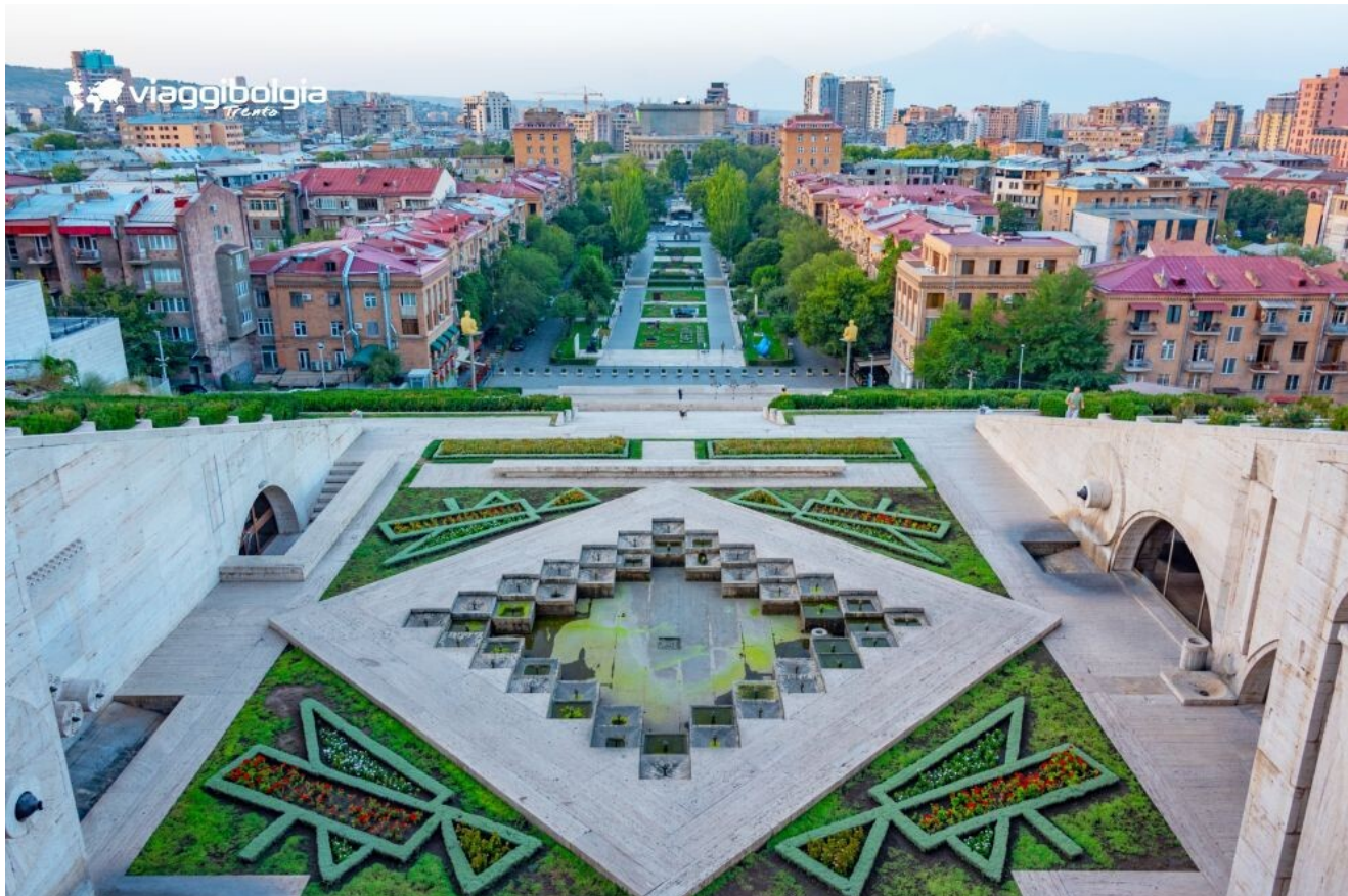
Cascade - il complesso monumentale nel centro di Yerevan