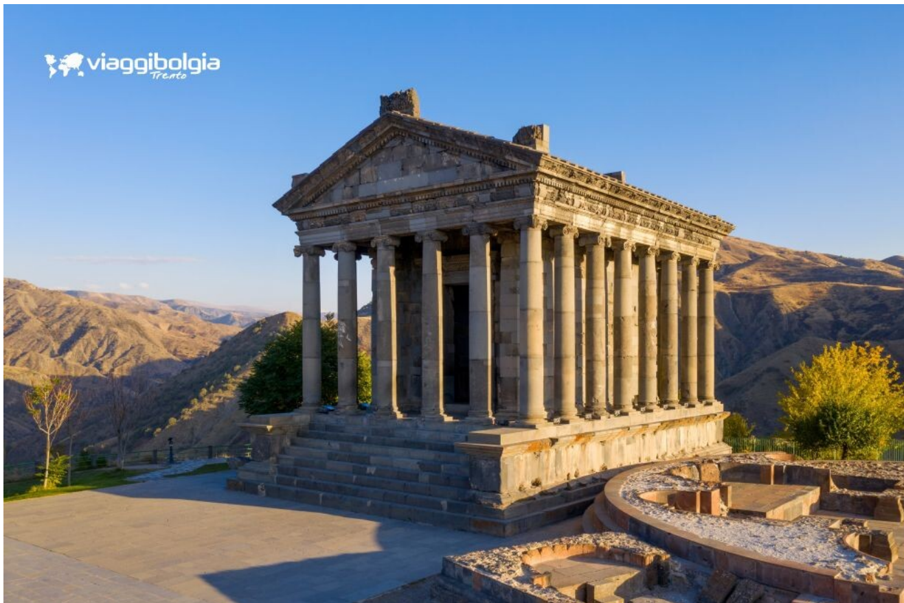
Garni - Tempio ellenistico