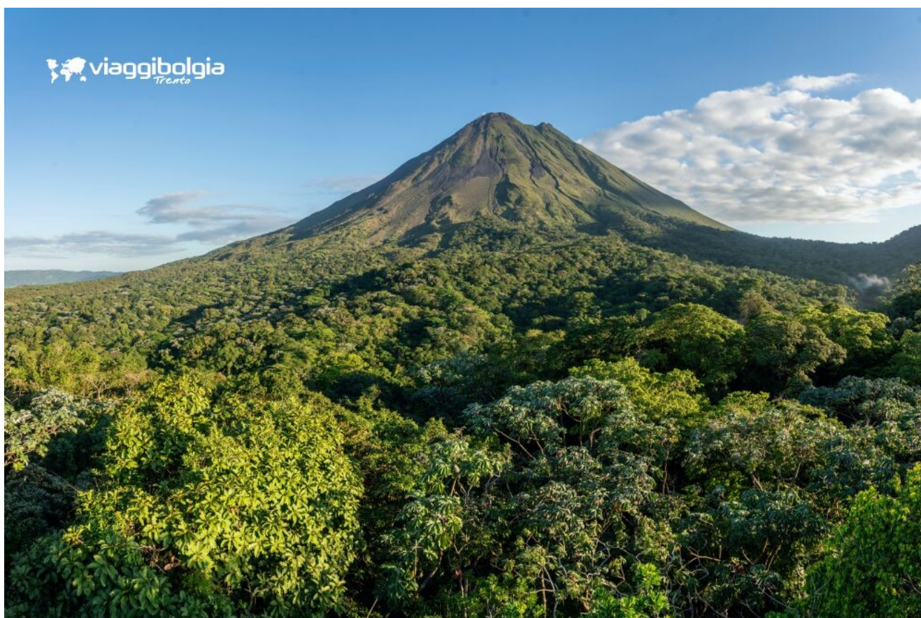
Il vulcano Arenal domina la foresta tropicale del Costa Rica con la sua perfetta forma conica

Arrivo a Manuel Antonio , una delle località più suggestive della costa pacifica, dove la foresta tropicale incontra spiagge chiare e acque cristalline. Sistemazione in hotel, cena in ristorante e pernottamento.