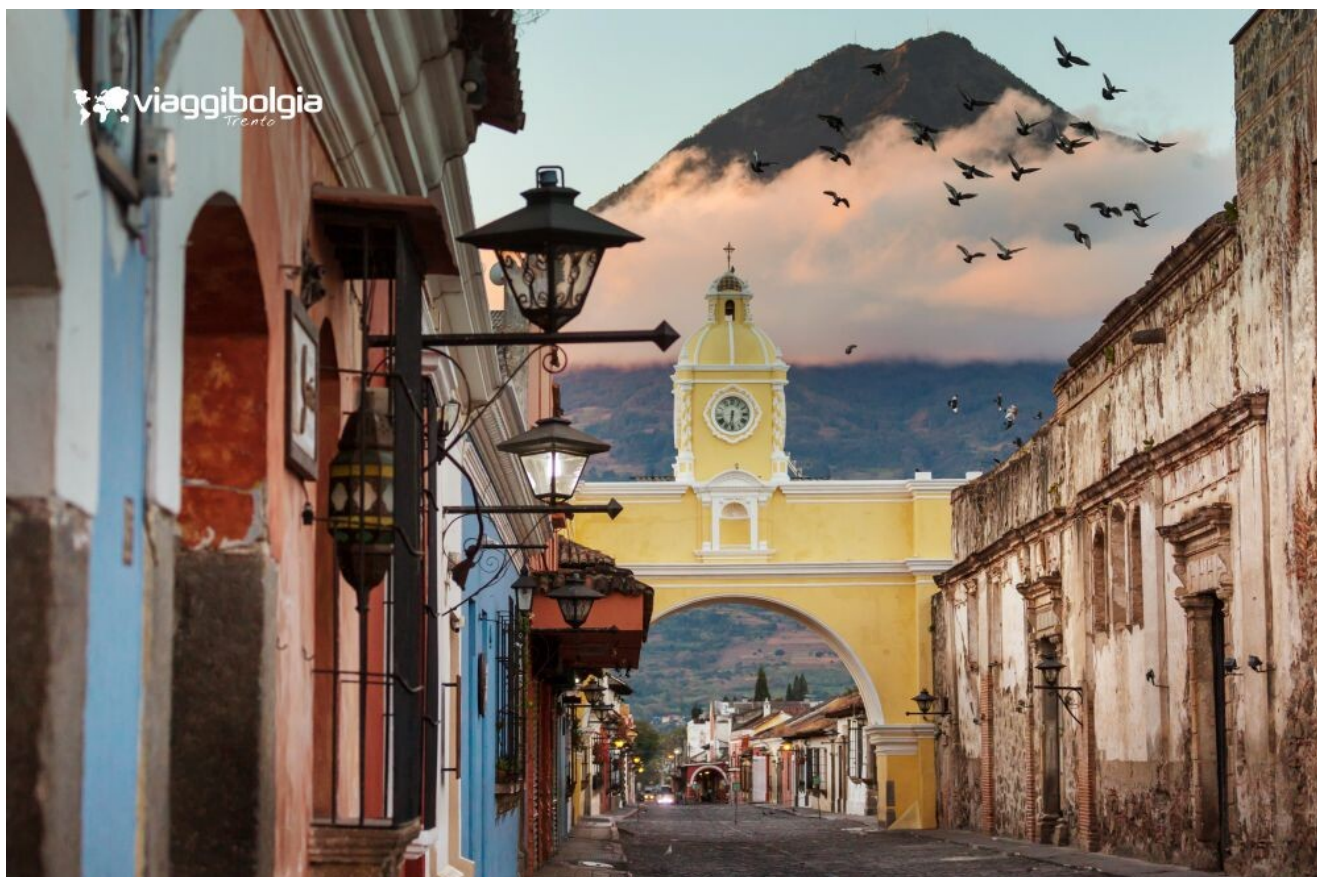
Antigua Guatemala, tra chiese coloniali, vicoli colorati e il profilo dei vulcani che dominano la città