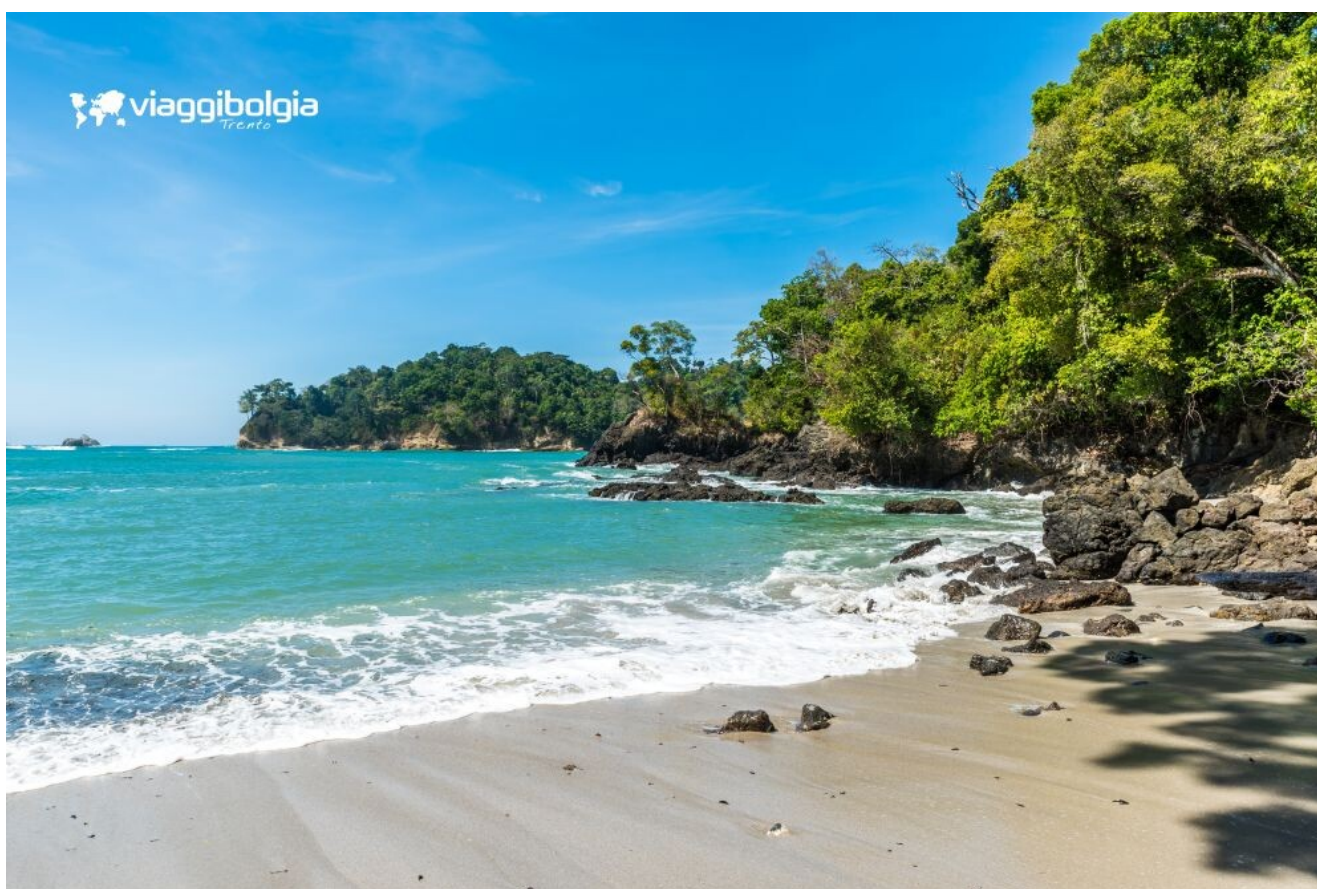
Spiagge tropicali e foresta nel Parco Nazionale Manuel Antonio

Pranzo in ristorante locale. Pomeriggio a disposizione per il relax al mare: la baia principale è protetta, con acque calme e sabbia chiara. Cena in ristorante e pernottamento in hotel.