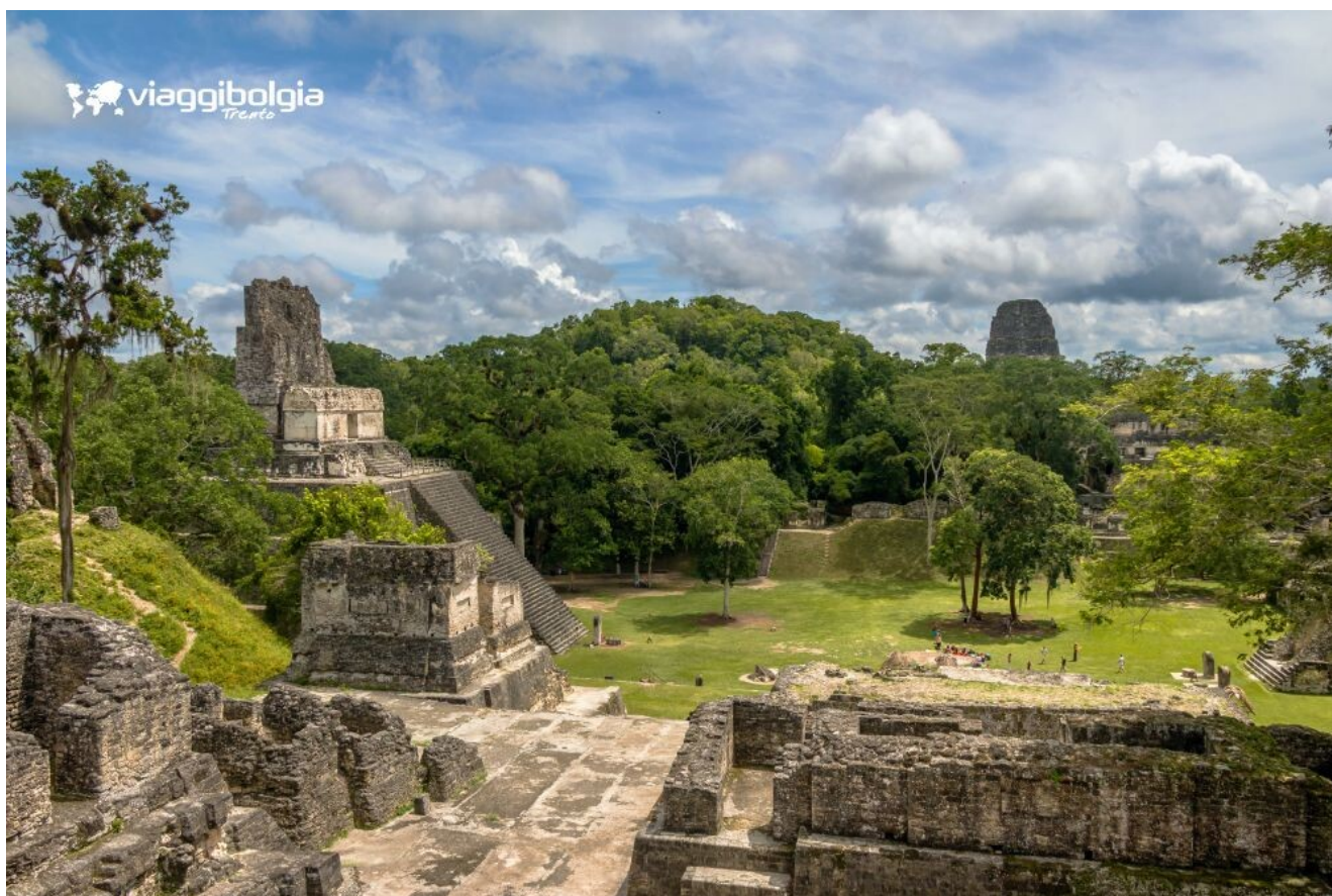
Tikal, una delle più grandi città maya dell'America Centrale, immersa nella giungla del Petén

Al termine trasferimento all'aeroporto di Flores e volo per Guatemala City . Arrivo, trasferimento e sistemazione in hotel. Cena in ristorante e pernottamento.