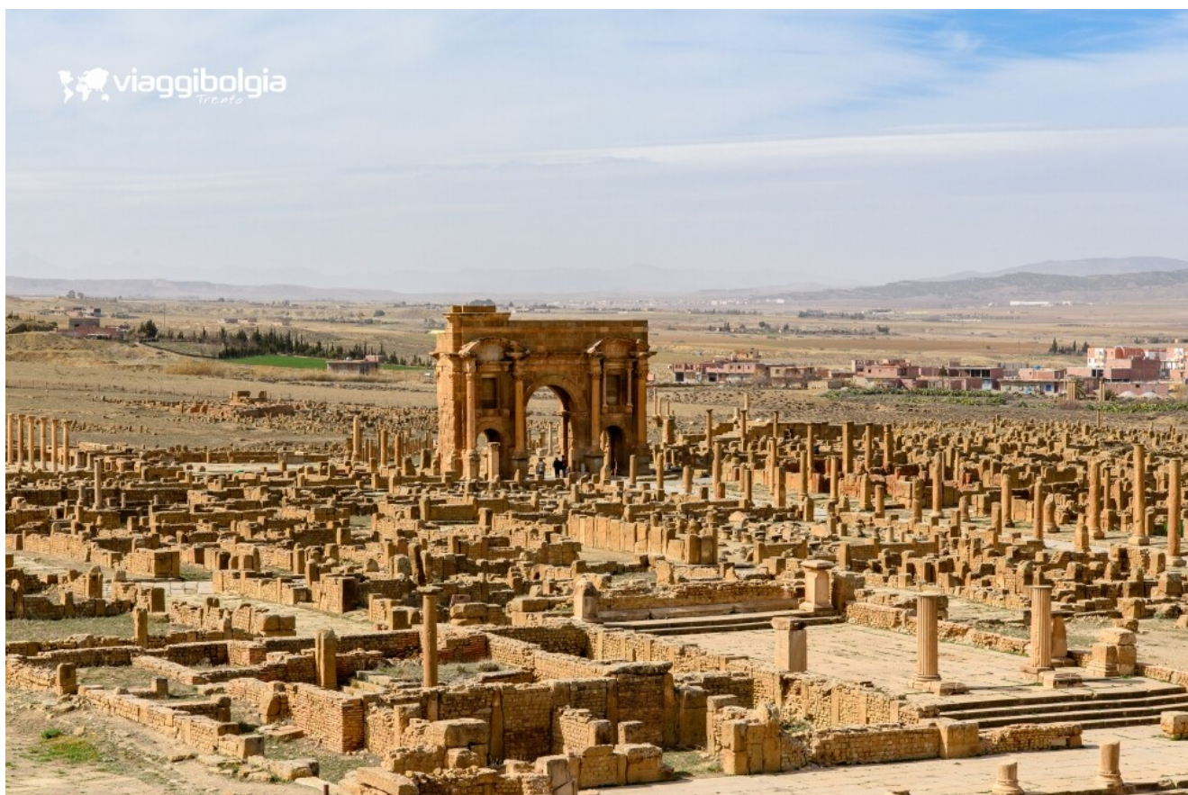
Arco di Traiano a Timgad, un imponente arco trionfale alto 12 metri che segnava l'ingresso alla città

Dopo la visita, sistemazione in hotel. Cena e pernottamento.