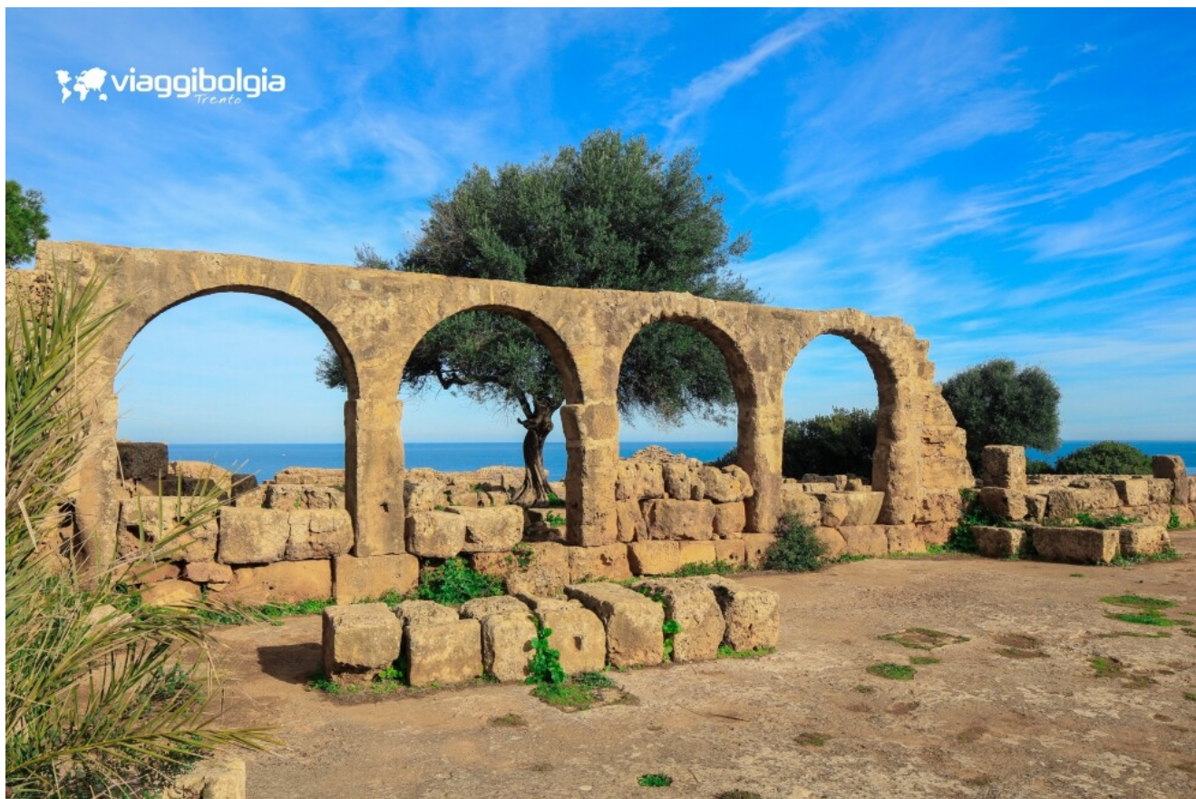
Antiche rovine romane del sito archeologico di Tipasa, Patrimonio UNESCO