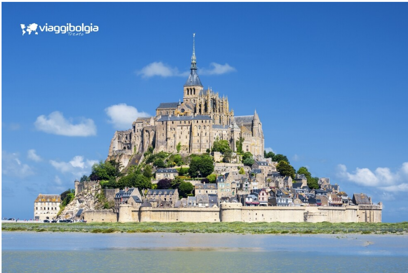
Mont-Saint-Michel, riconosciuto come Patrimonio Mondiale dell'Umanità per la sua eccezionale architettura medievale