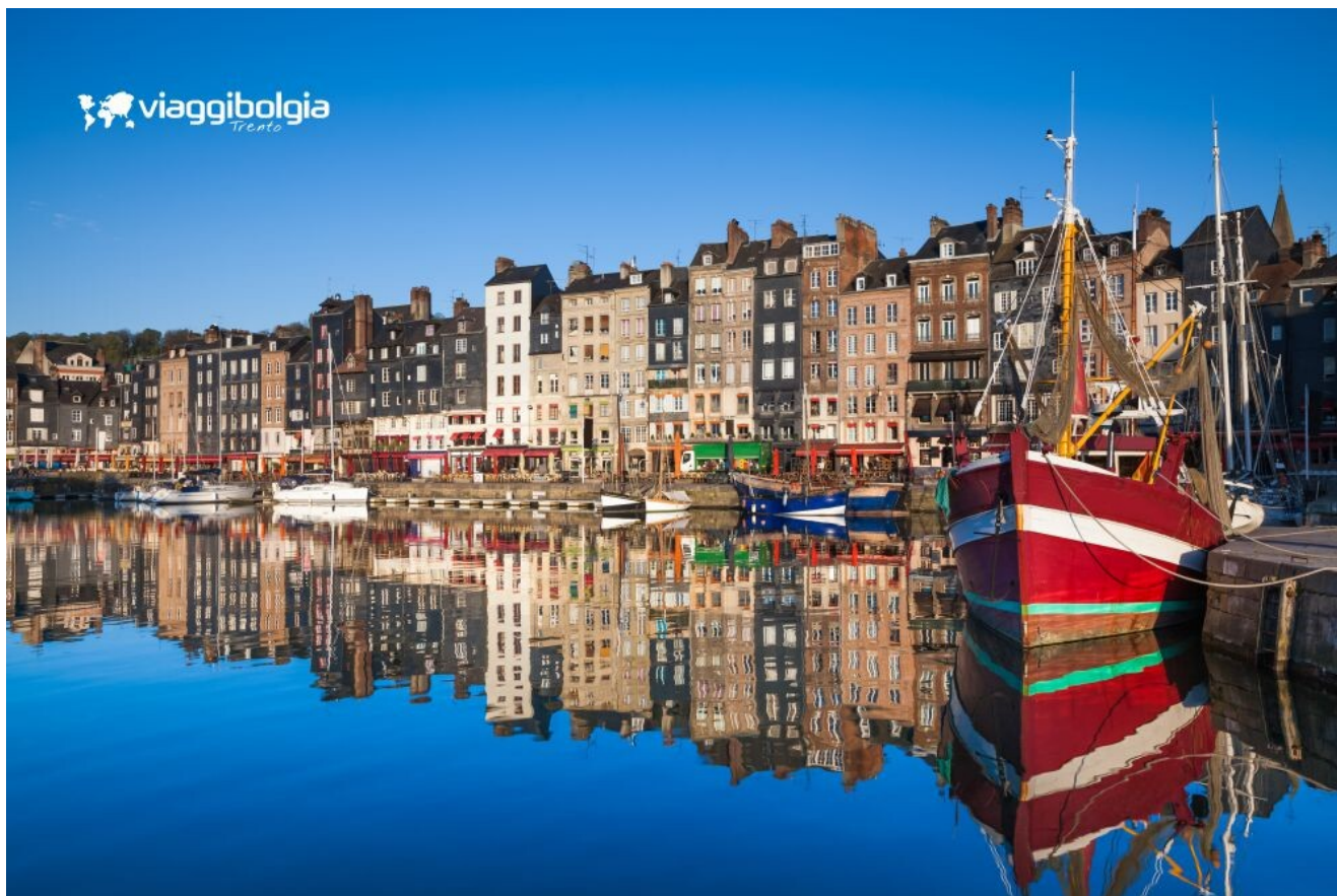
Il suggestivo Vieux Bassin (Vecchio Bacino) di Honfleur

La giornata si conclude a Honfleur , antichissimo porto d'artisti dove il tramonto è magnifico. Le sue strette case in ardesia si specchiano sul Vieux Bassin , creando giochi di luce che hanno ispirato Monet , Boudin e tanti impressionisti. Rientro in hotel.