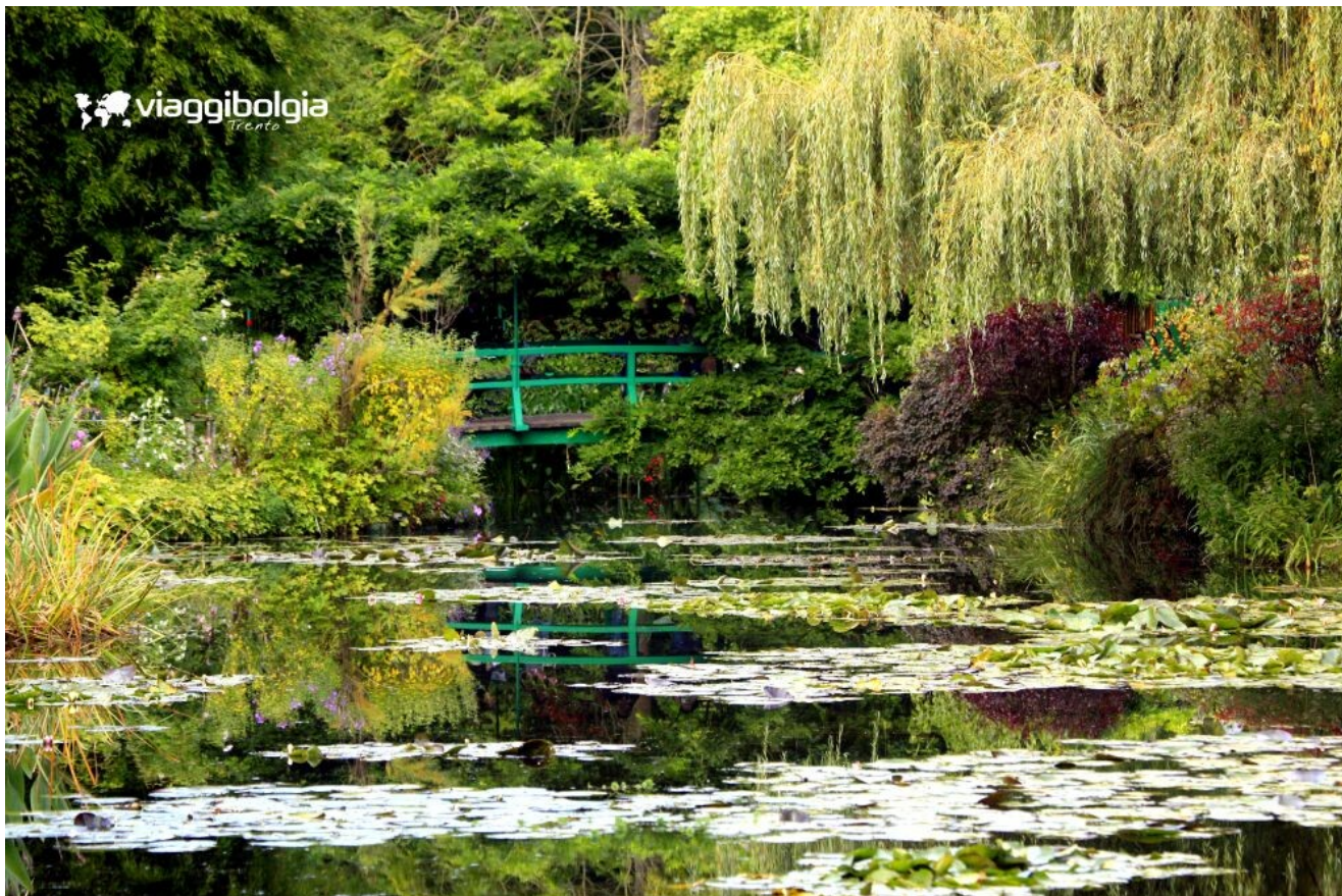
Il giardino d'Acqua nella casa di Claude Monet a Giverny