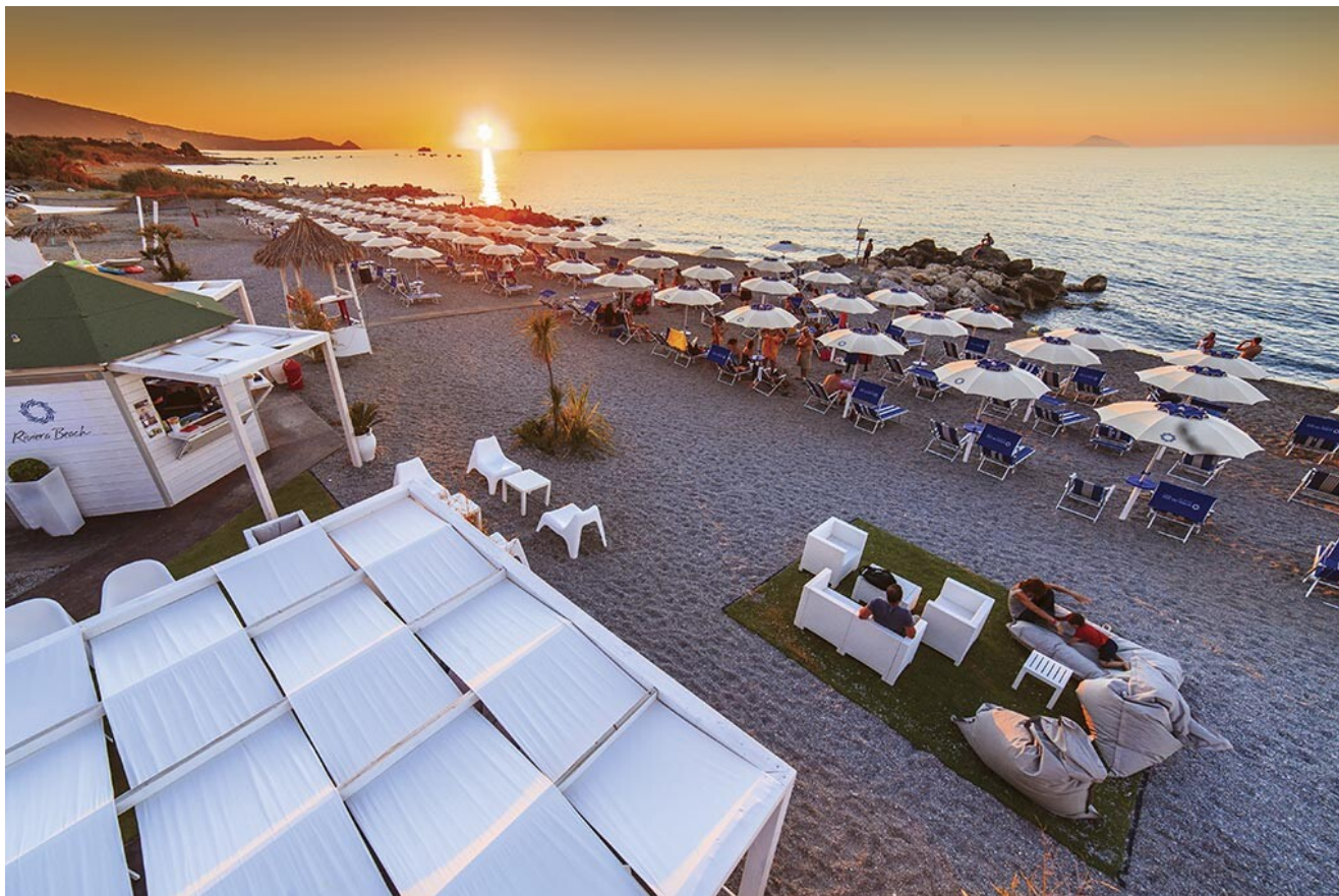
Spiaggia privata dell'Hotel Resort Spa Riviera del Sole, tra Capo d'Orlando e Capo Calavà