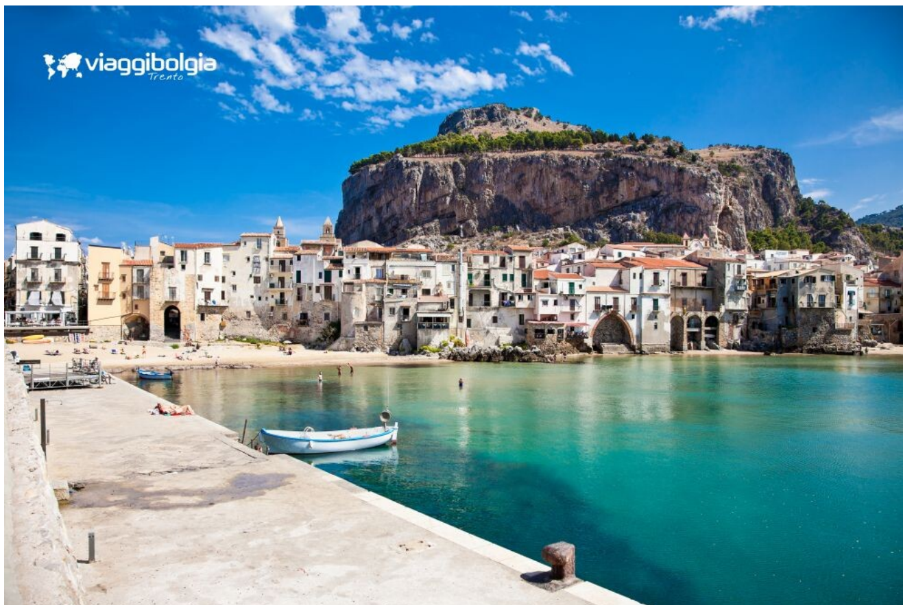
Cefalù e l'imponente promontorio roccioso che domina il paesaggio

Rientro in hotel per il pranzo. Nel pomeriggio tempo a disposizione per il relax o per attività balneari, approfittando delle strutture dell'hotel o del mare.