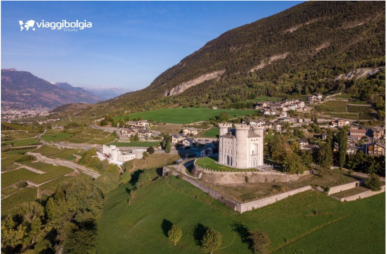
Castello di Aymavilles, tra architettura storica e restauro recente

Proseguimento per il Castello di Fénis , simbolo della Valle d'Aosta, con torri, cortili interni e affreschi che raccontano l'immaginario del Medioevo valdostano.