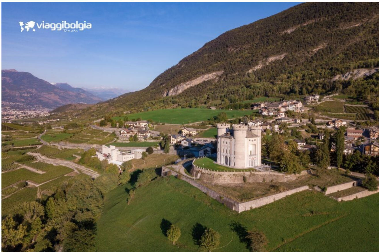
Castello di Aymavilles, tra architettura storica e restauro recente

Proseguimento per il Castello di Fénis , simbolo della Valle d'Aosta, con torri, cortili interni e affreschi che raccontano l'immaginario del Medioevo valdostano.