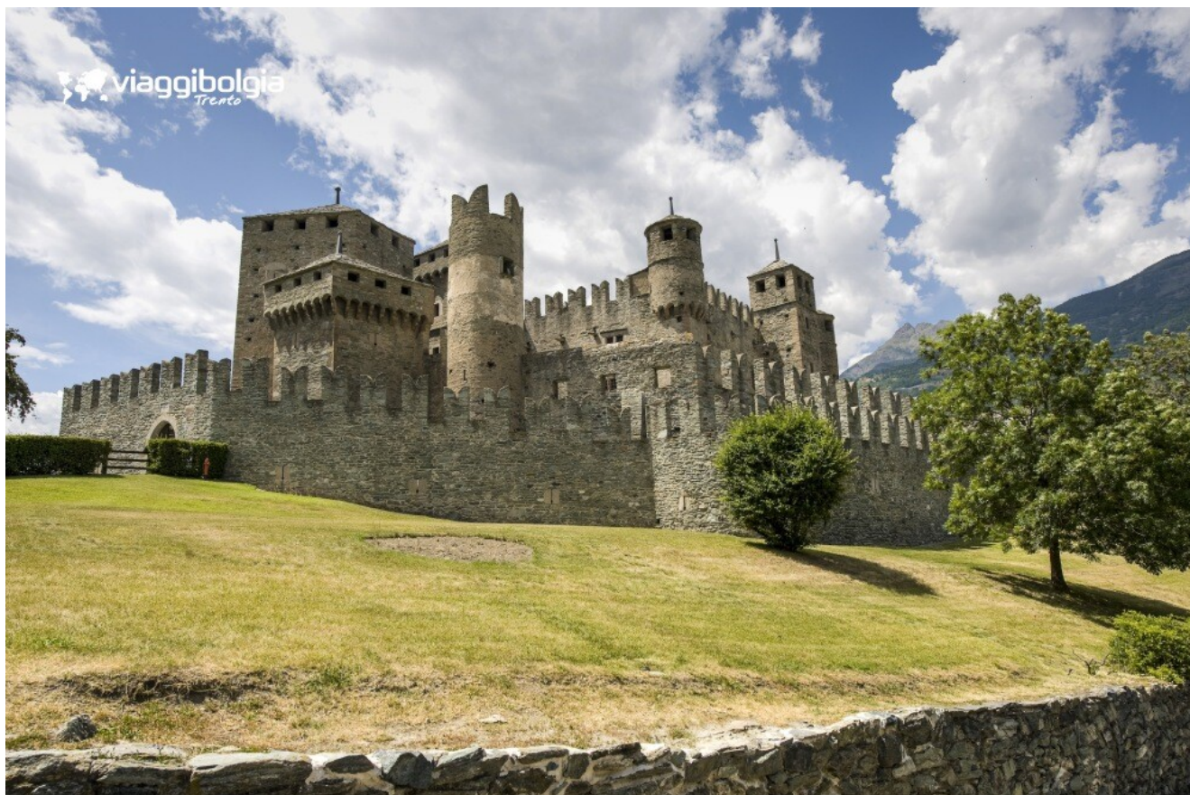
Castello di Fénis, uno dei simboli medievali della regione

Pranzo in agriturismo con menù tipico valdostano (antipasti della casa, primi, polenta con carne, dolce e bevande incluse).