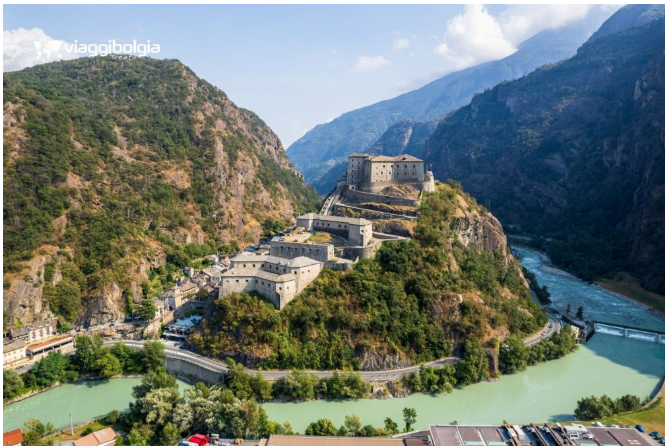
Forte di Bard, la porta monumentale della Valle d'Aosta

Nel pomeriggio trasferimento ad Aosta e sistemazione in hotel. Cena e pernottamento.