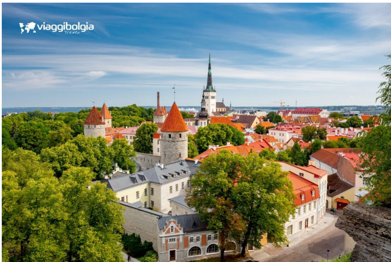
Tallin, capitale dell'Estonia, la più antica dell'Europa settentrionale d'impronta medievale.