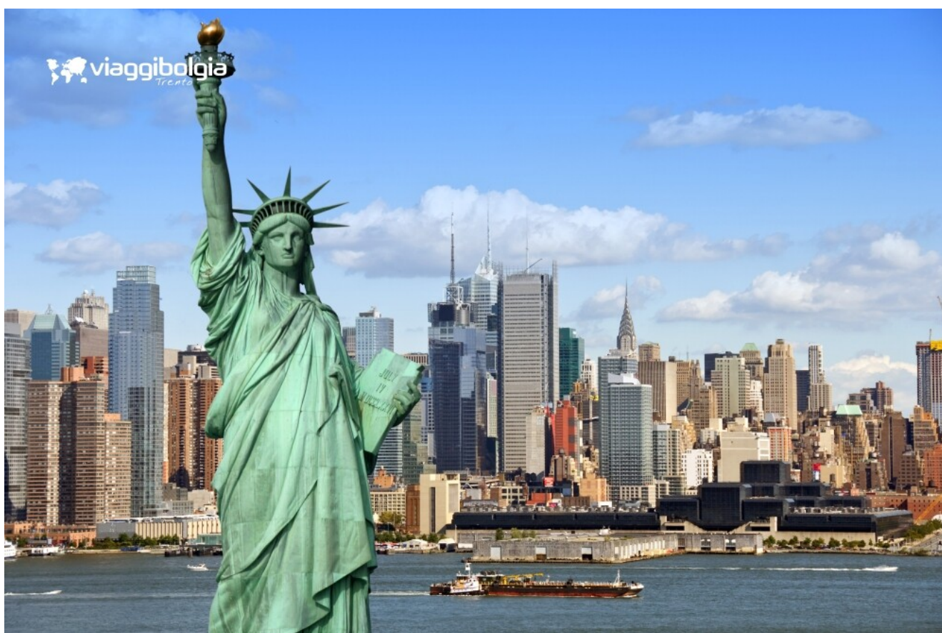
Statua della Libertà e Skyline di New York City

Trasferimento in metropolitana a Battery Park dove si prende il battello per la Statua della Libertà e Ellis Island , con la visita dell'emozionante museo dell'Immigrazione. Sulla via di rientro, sosta fotografica al Flatiron Building . Lì vicino impera l' Empire State Building dove, chi gradisce, potrà salire fino all' osservatorio (a pagamento). Per gli interessati, sosta da Macy's, il più grande magazzino del mondo. Serata libera e pernottamento.