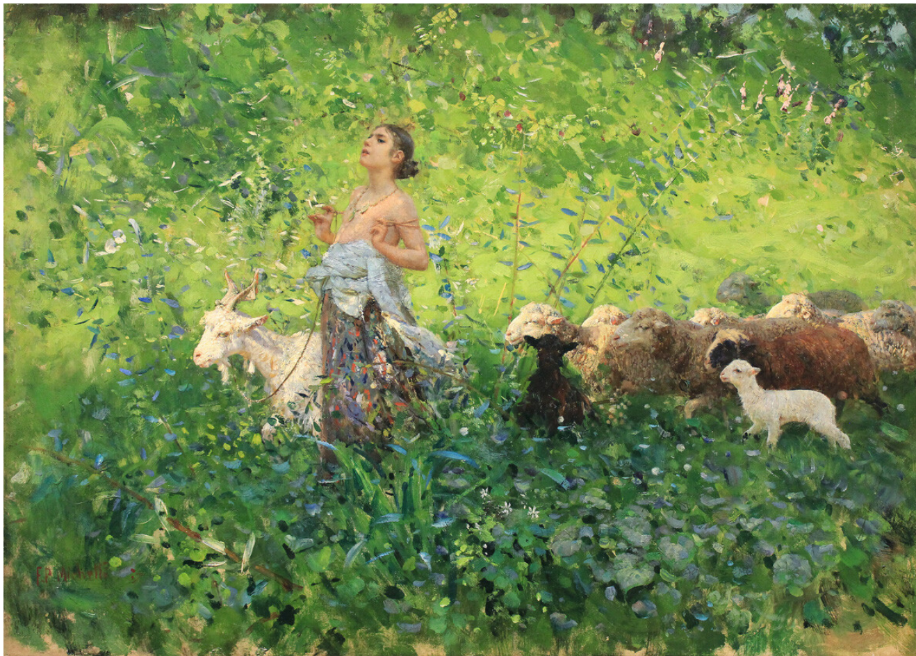
Francesco Paolo Michetti, La gioia di vivere , olio su tela, 1887, collezione privata

Visita guidata alla mostra Il Simbolismo in Italia, Origini e sviluppi di una nuova estetica 1883-1915 . La natura come organismo vivente , il mito come esperienza perturbante , la figura femminile come presenza ambivalente, il paesaggio come spazio dell'interiorità , il segno grafico come veicolo dell'invisibile : sono i nuclei tematici delle sette sezioni della mostra, concepite per restituire tutta la complessità e l'ampiezza dell'immaginario simbolista italiano. Tra gli artisti in mostra Giovanni Segantini, Giuseppe Pellizza da Volpedo, Gaetano Previati, Arnold Böcklin, Edward Burne-Jones, Franz von Stuck, Max Klinger, Domenico Morelli, Plinio Nomellini, Ettore Tito, Ettore Ximenes, Mariano Fortuny e molti altri.