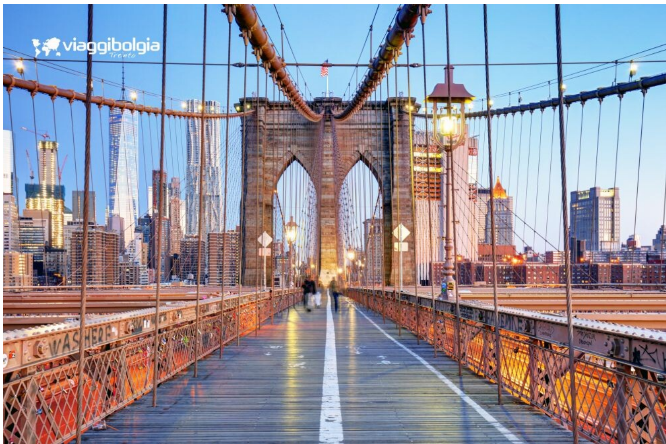
Ponte di Brooklyn