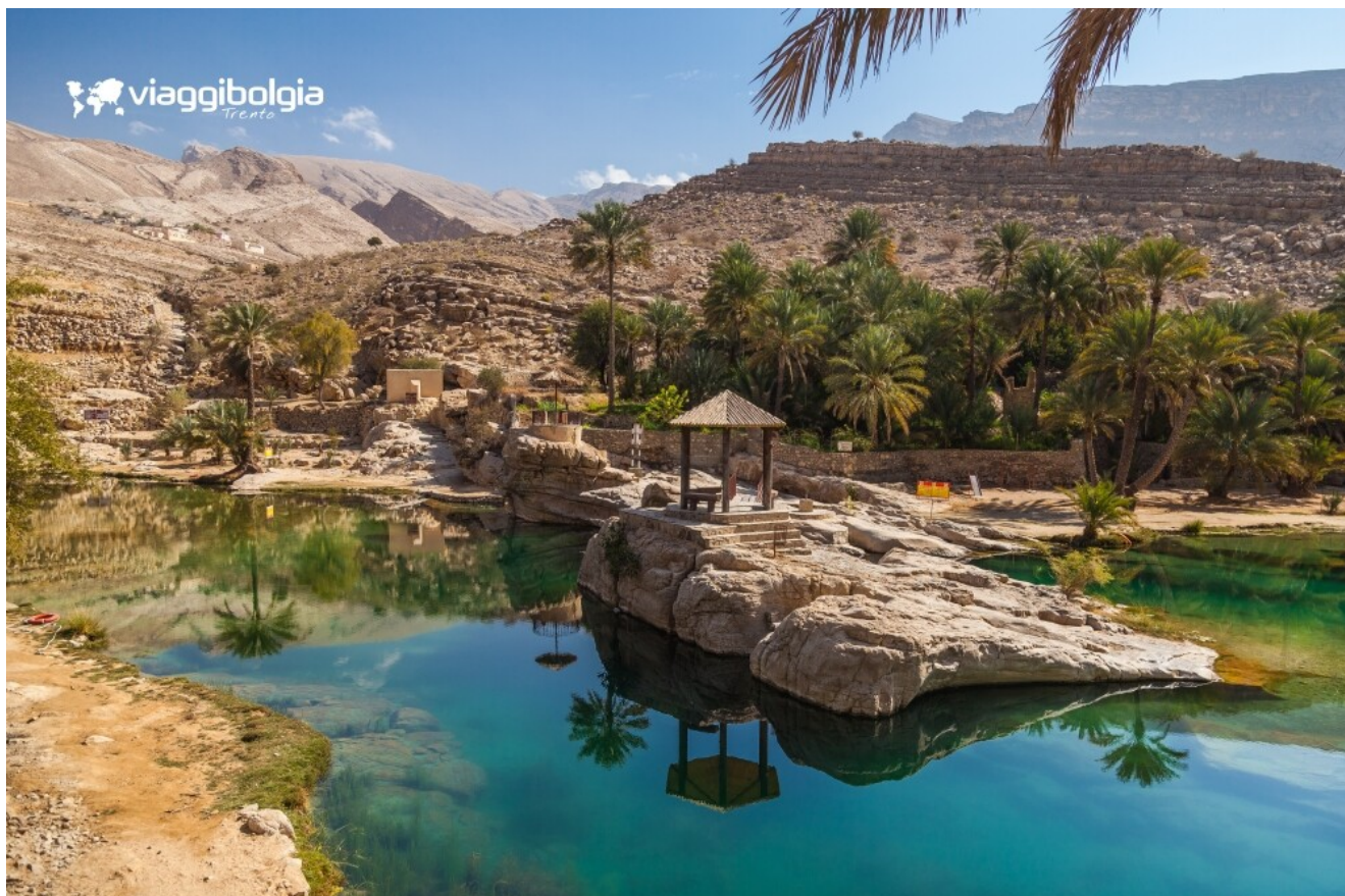
Wadi Bani Khalid