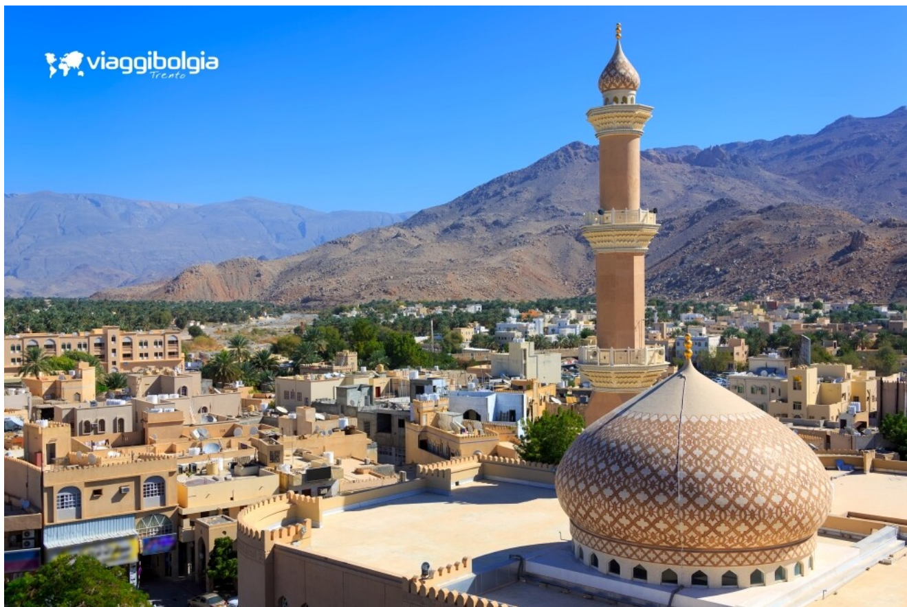
Nizwa, l'antica capitale omanita, oggi capitale culturale

Pranzo in ristorante e pomeriggio dedicato alla visita del Grand Canyon d'Arabia, Jebel Shams , il canyon più profondo della penisola arabica, circa 1000 m, formatosi 15 milioni di anni fa. Sosta a Wadi Ghul , chiamato il villaggio fantasma, di epoca persiana, un esempio di insediamento abbandonato in stile tradizionale omanita. Infine si raggiunge Nizwa per la cena e il pernottamento in hotel.