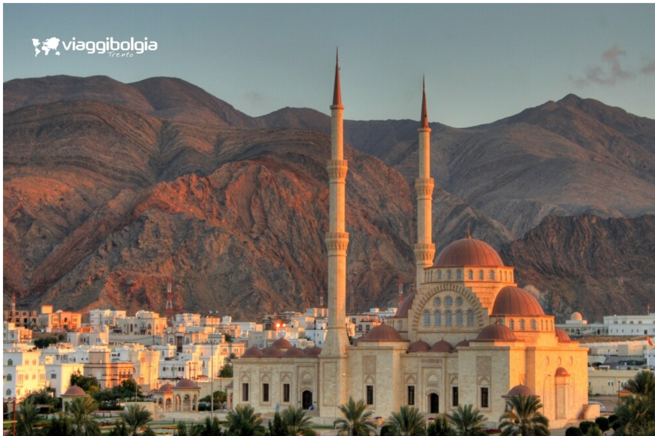
Muscat - moschea Said Bin Taimur