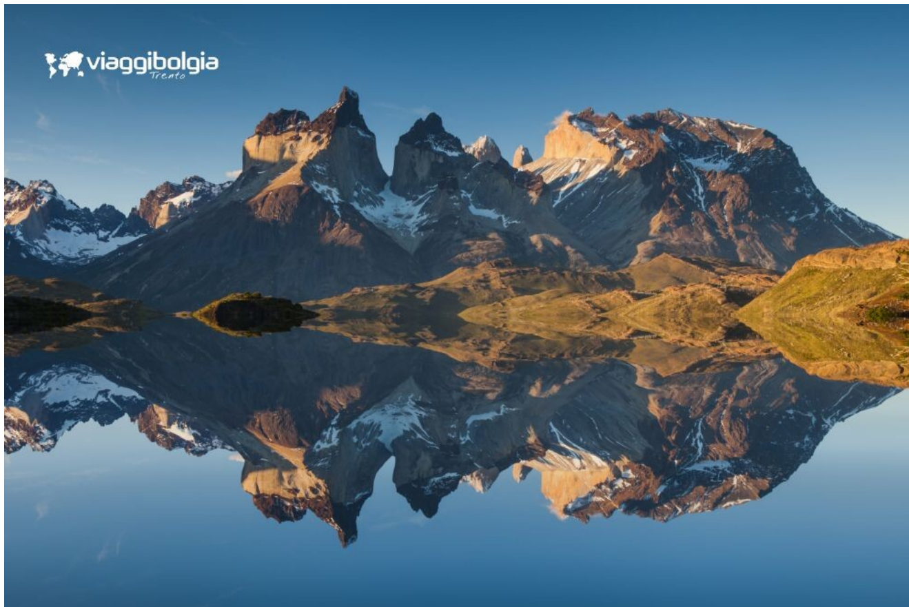
Cuernos del Paine, i celebri pinnacoli di granito che caratterizzano il Parco