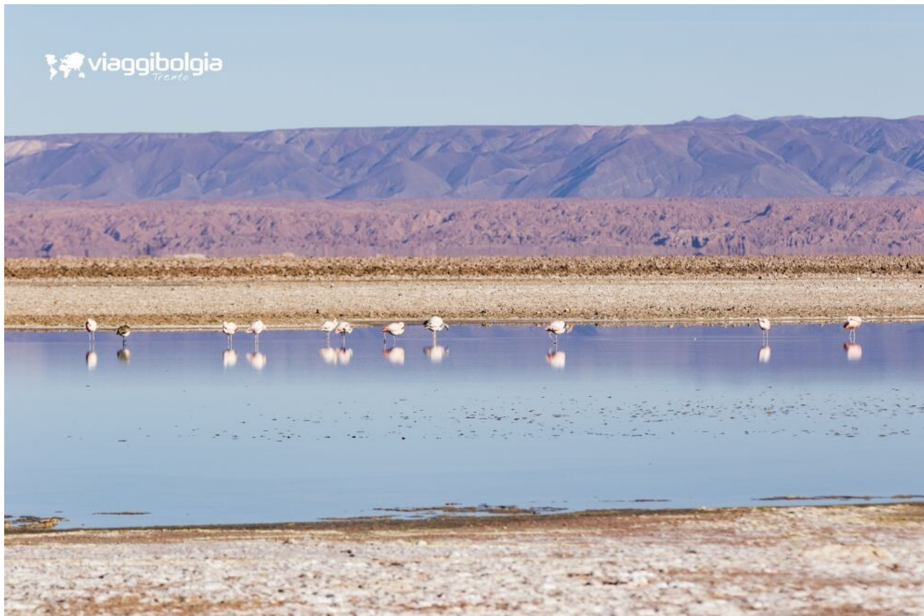
Laguna Chaxa habitat di migliaia di fenicotteri rosa, presso Salar de Atacama