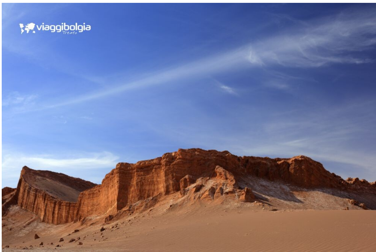
La Valle della Luna

Nel pomeriggio partenza per la Valle della Luna , nella Cordillera de la Sal . Soste per fotografare l'imponente Salt Mountain Rangel , uno spettacolo geologico con forme scultoree, come la superficie lunare, prodotta da successive pieghe della crosta terrestre. Visita delle statue di sale Las Tres Marías e sosta al belvedere di Kari per ammirare il tramonto e gustare un aperitivo di formaggi e vini cileni. Ritorno in hotel, cena e pernottamento.