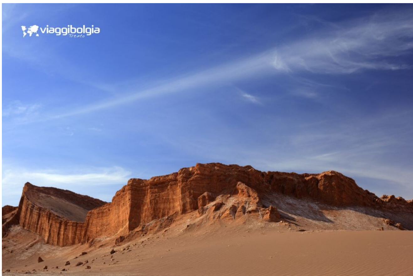
La Valle della Luna

Nel pomeriggio partenza per la Valle della Luna , nella Cordillera de la Sal . Soste per fotografare l'imponente Salt Mountain Rangel , uno spettacolo geologico con forme scultoree, come la superficie lunare, prodotta da successive pieghe della crosta terrestre. Visita delle statue di sale Las Tres Marías e sosta al belvedere di Kari per ammirare il tramonto e gustare un aperitivo di formaggi e vini cileni. Ritorno in hotel, cena e pernottamento.