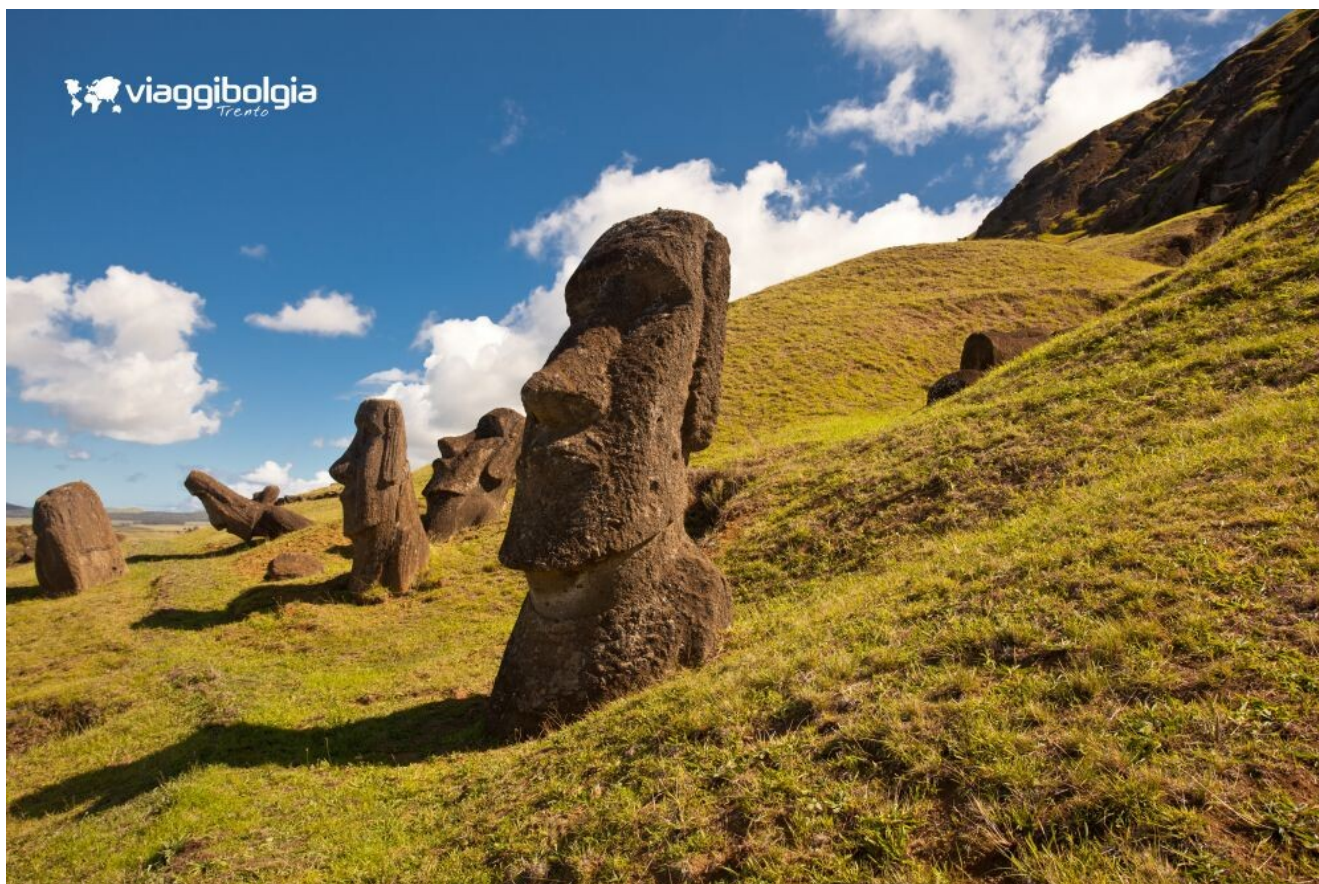
Le misteriose statue Moai disseminano sulle sue coste dell'Isola di Pasqua

Giornata dedicata alla scoperta archeologica della cultura Rapa Nui . Partenza per la costa settentrionale dell'isola e sosta nella baia di Anakena , un vero e proprio concentrato delle bellezze dei mari del sud. Visita di Ahu Te Pito Kura e delle straordinarie pendici del vulcano Rano Raraku , dai 396 Moai non completati o, semplicemente, abbozzati. Le pendici aride del vulcano e questi sguardi arcaici che puntano verso l'orizzonte sono la premessa del sorgere stesso del mito di Pasqua e dei suoi misteri. Pic-nic lunch e, nel pomeriggio, le visite proseguono con Ahu Tongariki , recentemente restaurato, la piattaforma di Ahu Akahanga , Ahu Vinapu e il centro di Hanga Roa . Rientro in serata, cena e pernottamento in hotel.