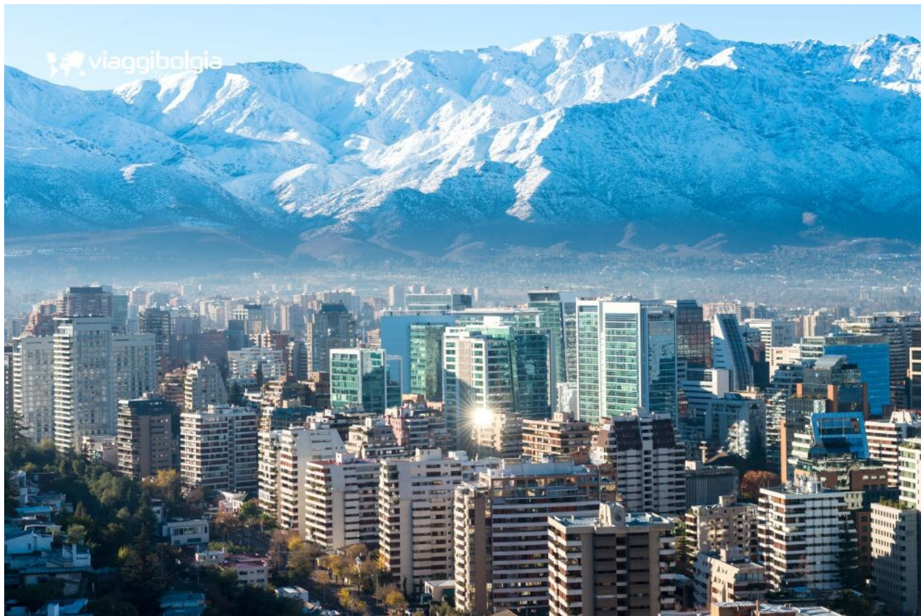
Santiago del Cile, circondata dalle cime innevate della Cordigliera delle Ande e della Cordigliera della Costa