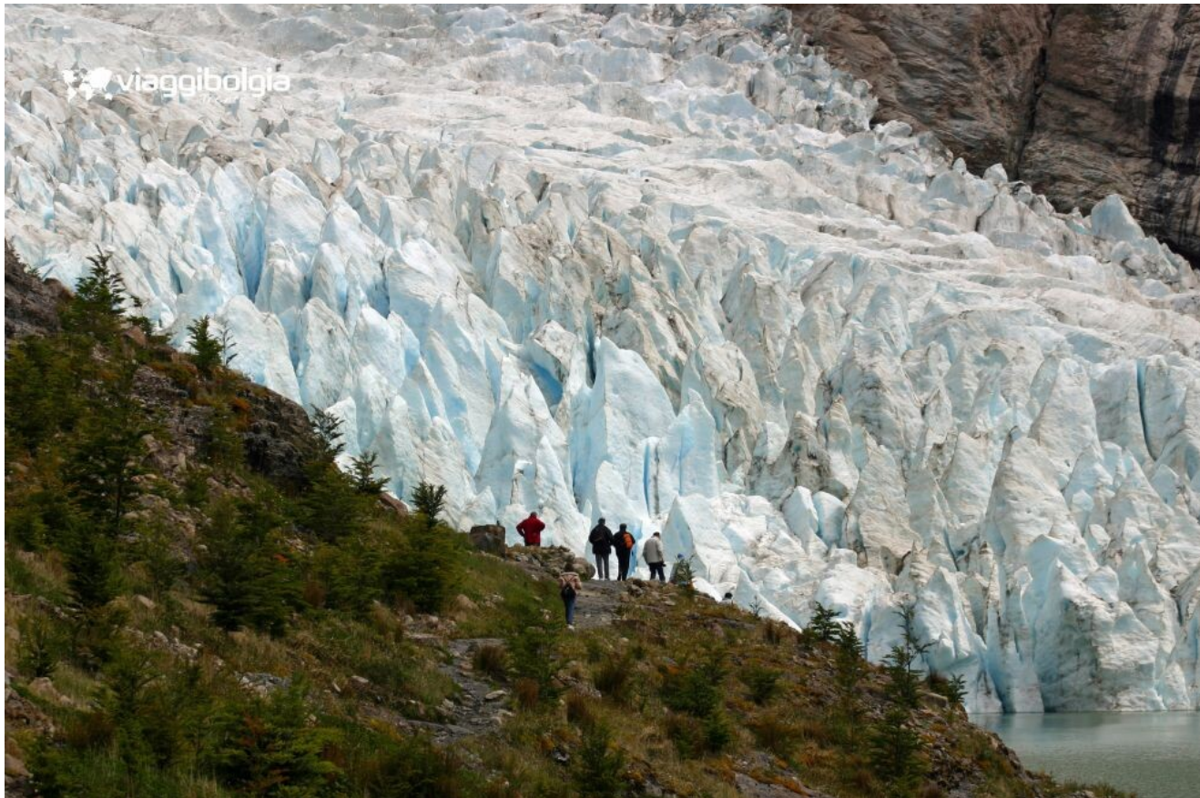
Il Parco Nazionale Torres del Paine e gli enormi ghiacciai di Balmaceda e Serrano