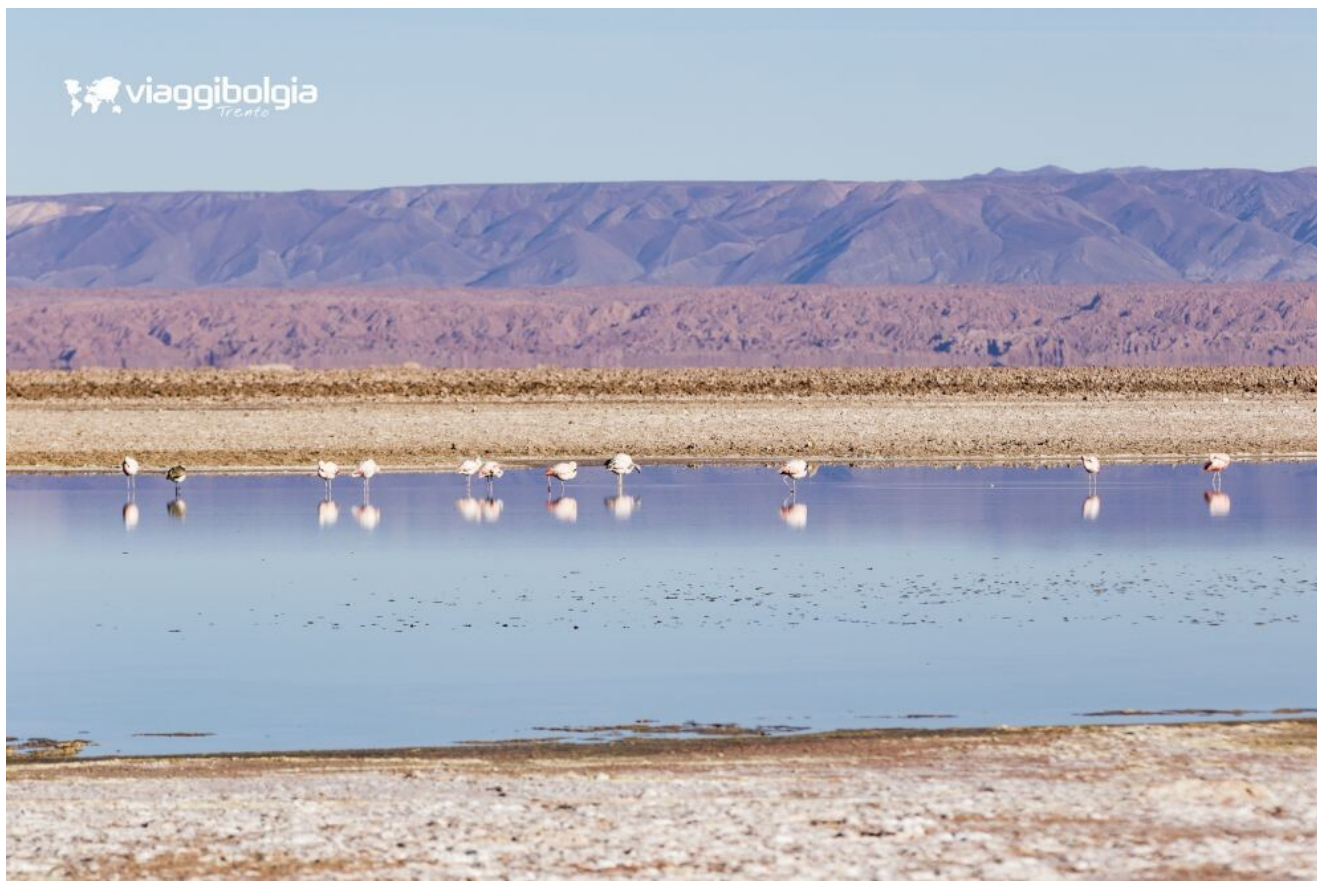
Laguna Chaxa habitat di migliaia di fenicotteri rosa, presso Salar de Atacama