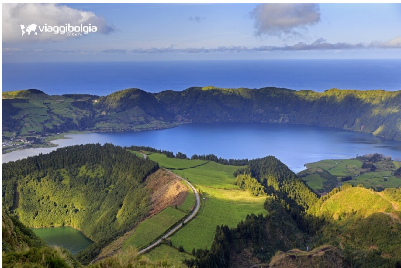
Sete Cidades, le lagune gemelle nel cratere vulcanico