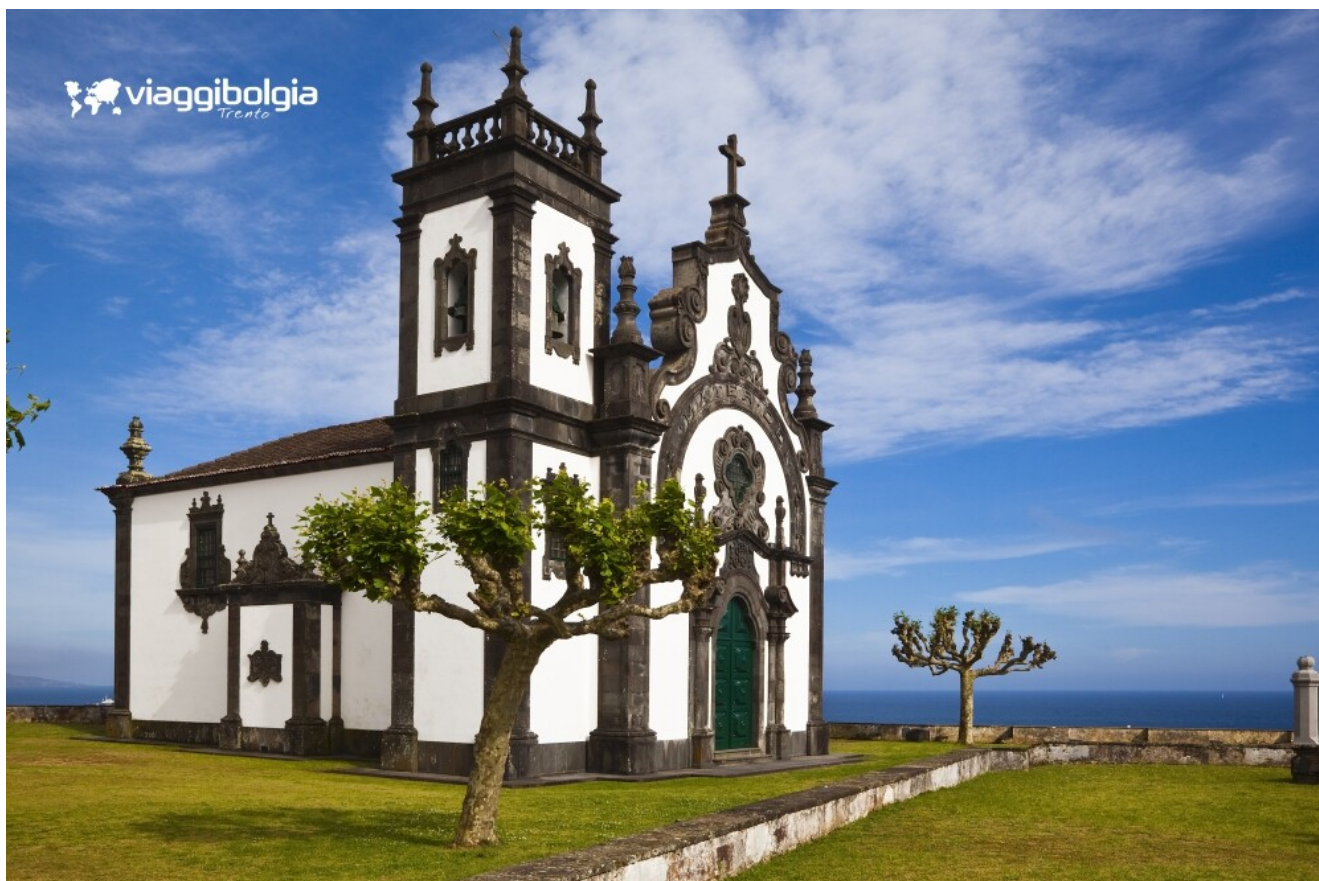
São Miguel - Ponta Delgada, Eremo della Madre di Dio