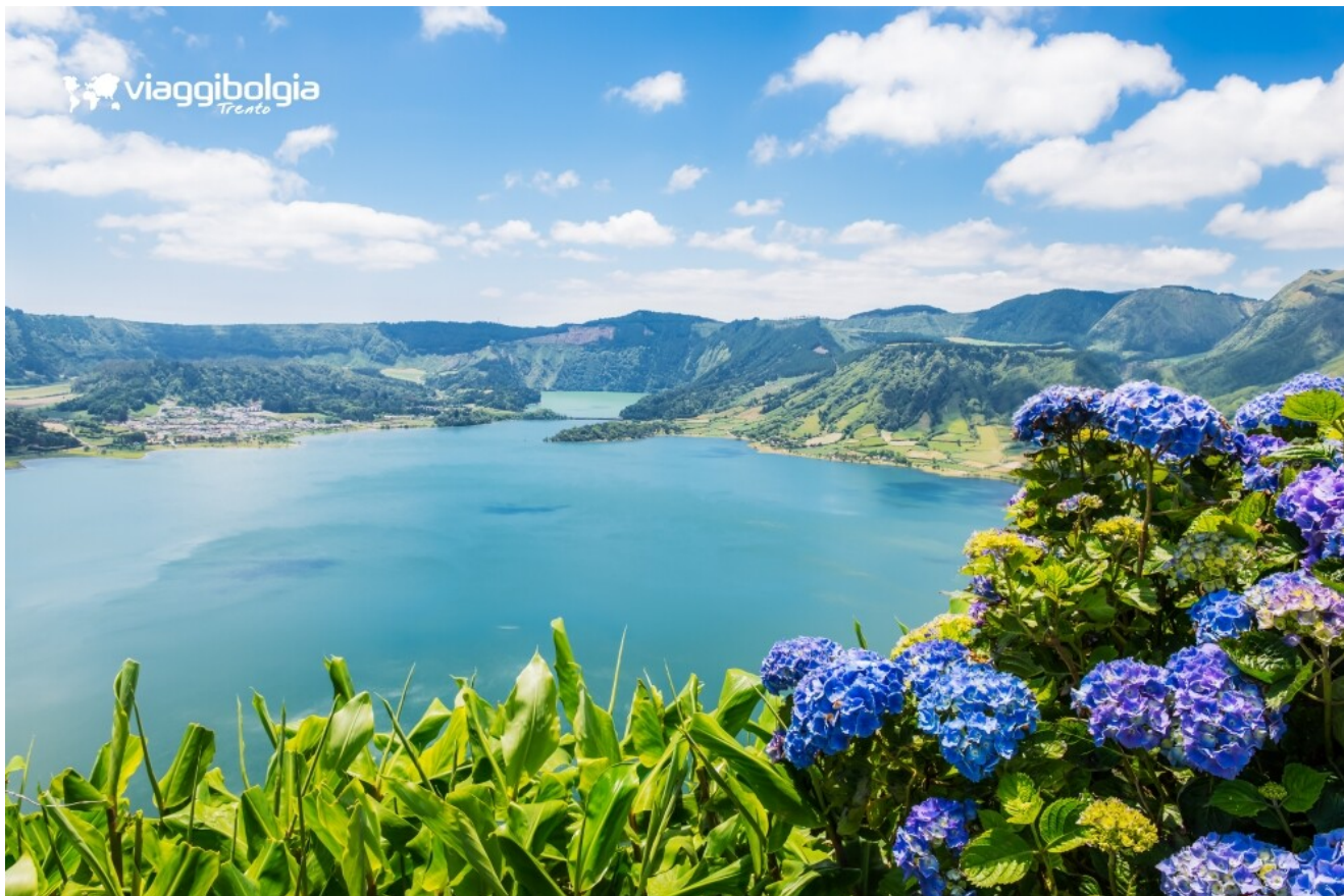
Sete Cidades, ortensie in fiore lungo la caldeira a giugno - le lagune gemelle nel cratere vulcanico