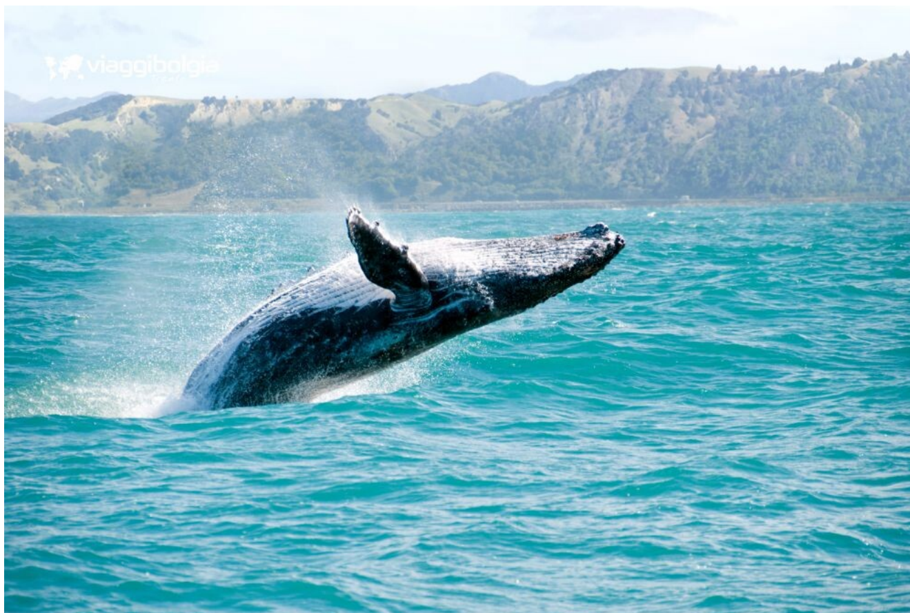
Whale Watching al Saguenay-St-Lawrence Marine Park