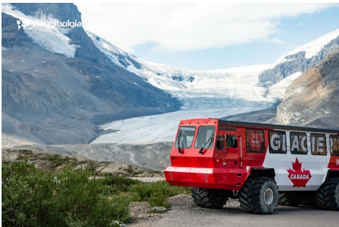
Escursione sul ghiacciaio Athabasca con i veicoli Ice Explorer

Nel pomeriggio salita sull' Athabasca a bordo di speciali veicoli Ice Explorer ed esplorazione a piedi di questo antico ghiacciaio datato 10.000 anni fa. Trasferimento in hotel per la cena.