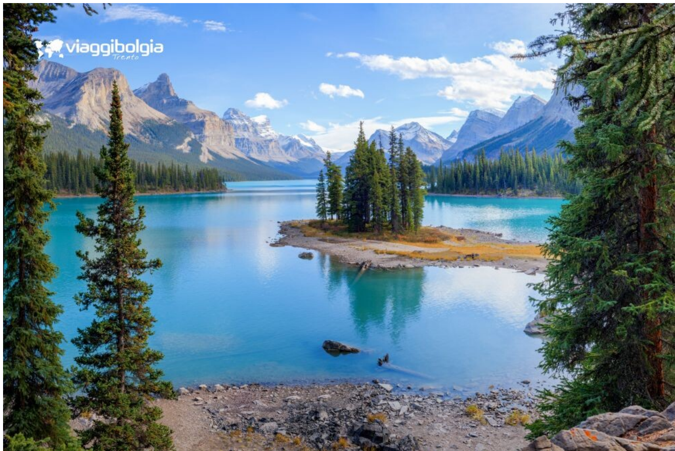
Spirit Island al lago Maligne