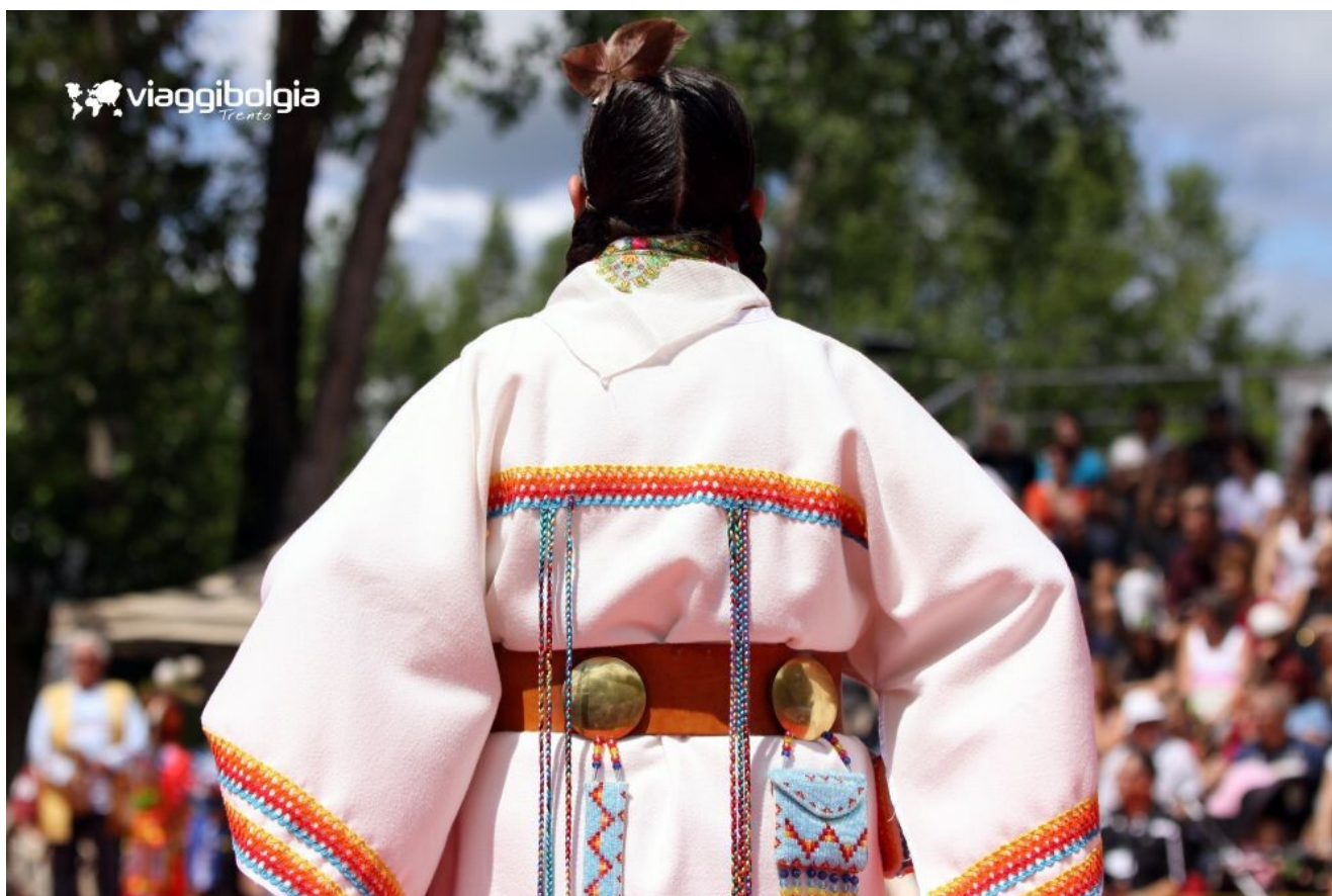
I Nativi al First Nation Site

All'arrivo giro panoramico in pullman per ammirare il Vieux Port, il Mont-Royal, il distretto finanziario e la città sotterranea. Cena in ristorante.