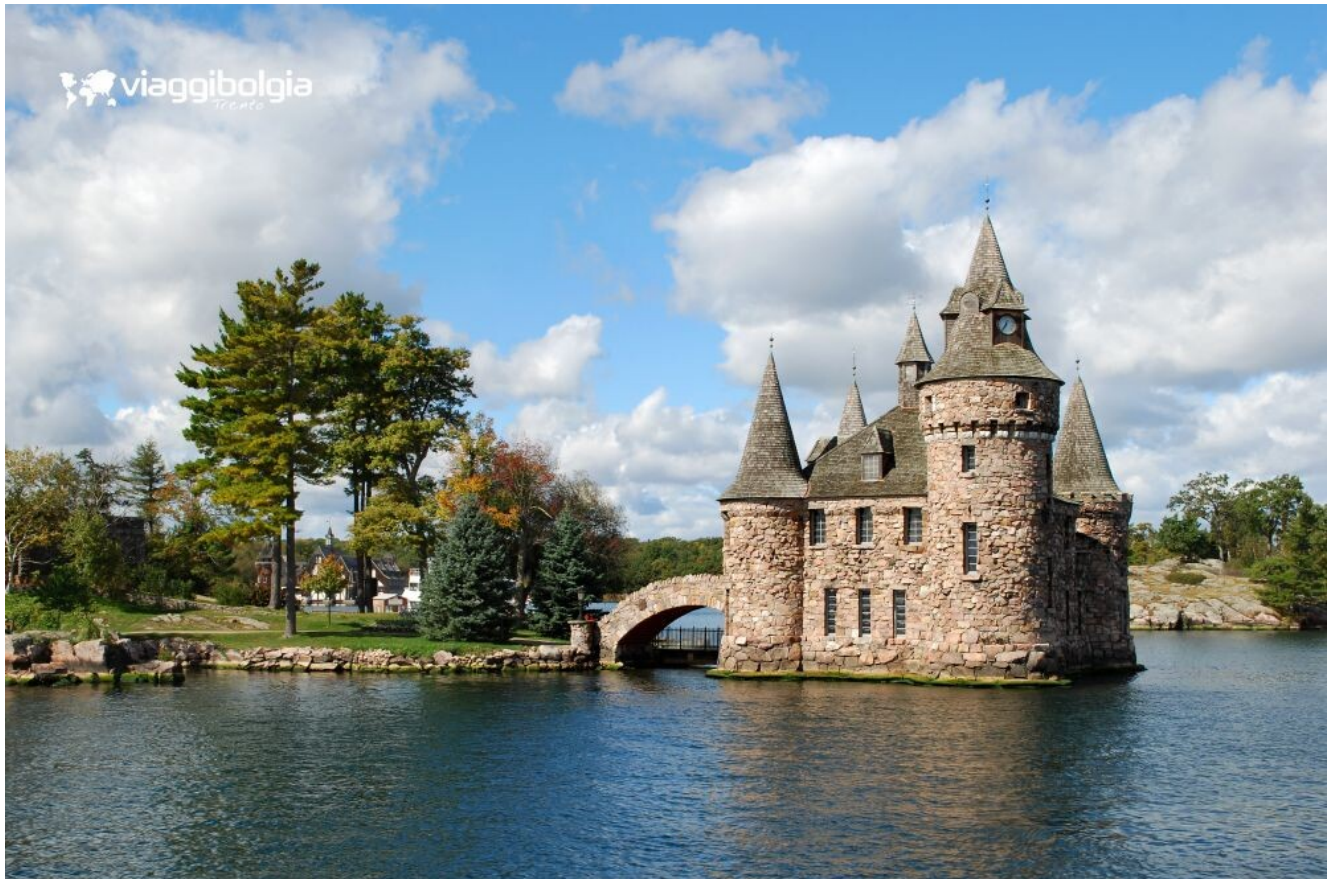
Le Mille Isole del San Lorenzo