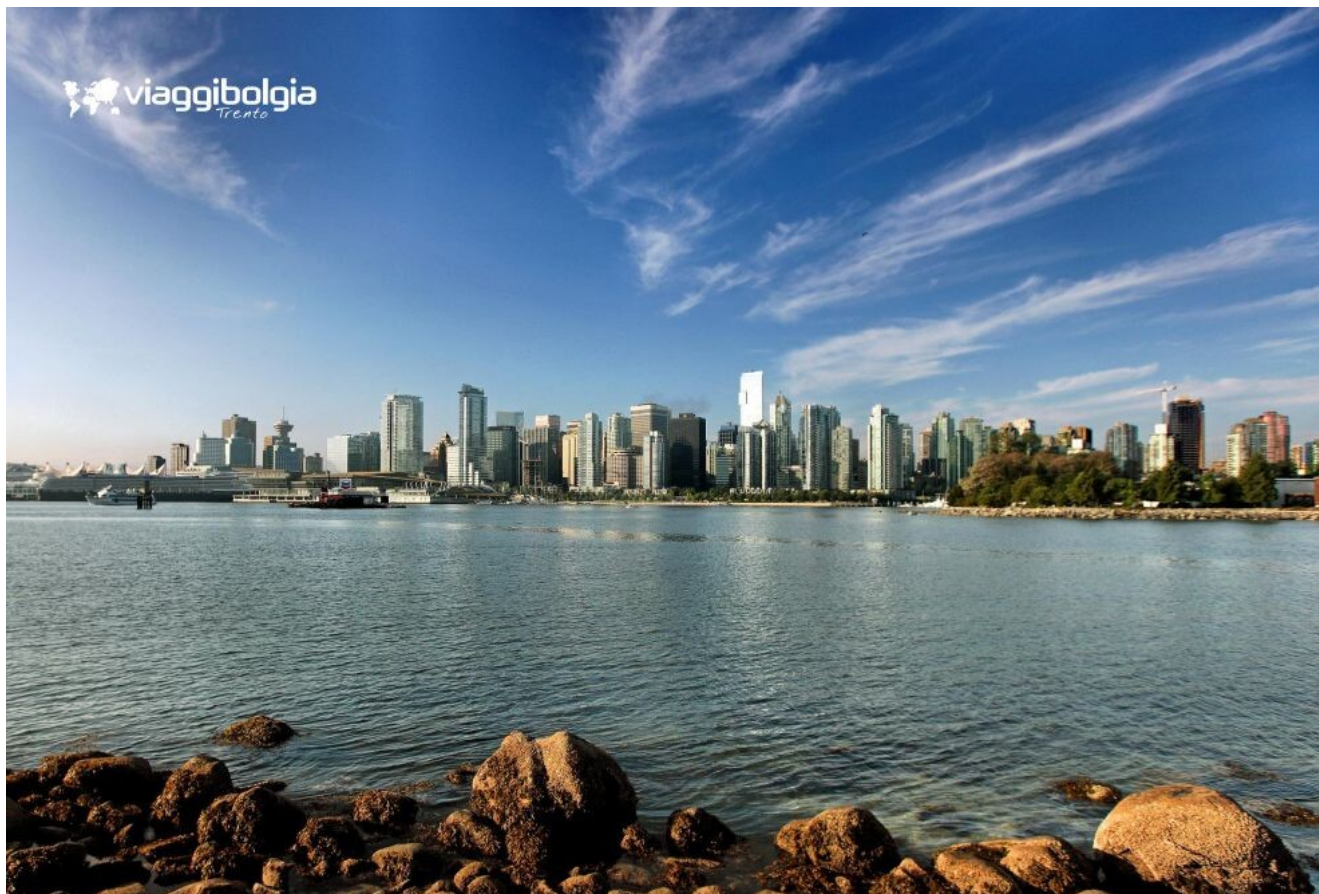
Vancouver, considerata una delle città più vivibili al mondo

Nel pomeriggio un po' di adrenalina con la passeggiata al Capilano Suspension Bridge , ponte sospeso lungo 140 metri a 70 metri d'altezza. Segue l'avventura nei Treetops , ponti sospesi tra enormi tronchi d'albero. Rientro a Vancouver. Cena libera.