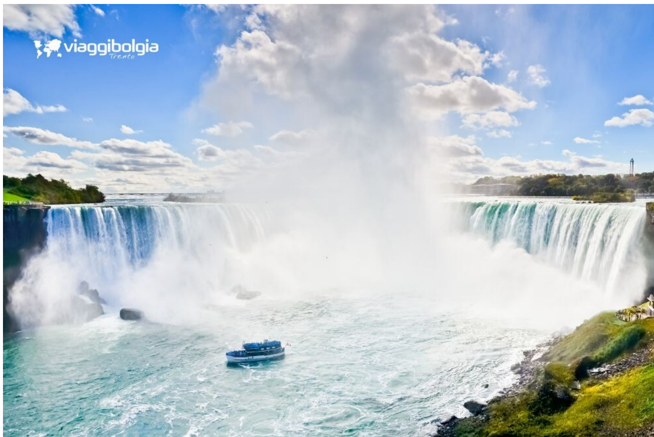
Le Cascate del Niagara, tra i più famosi salti d'acqua al mondo per vastità