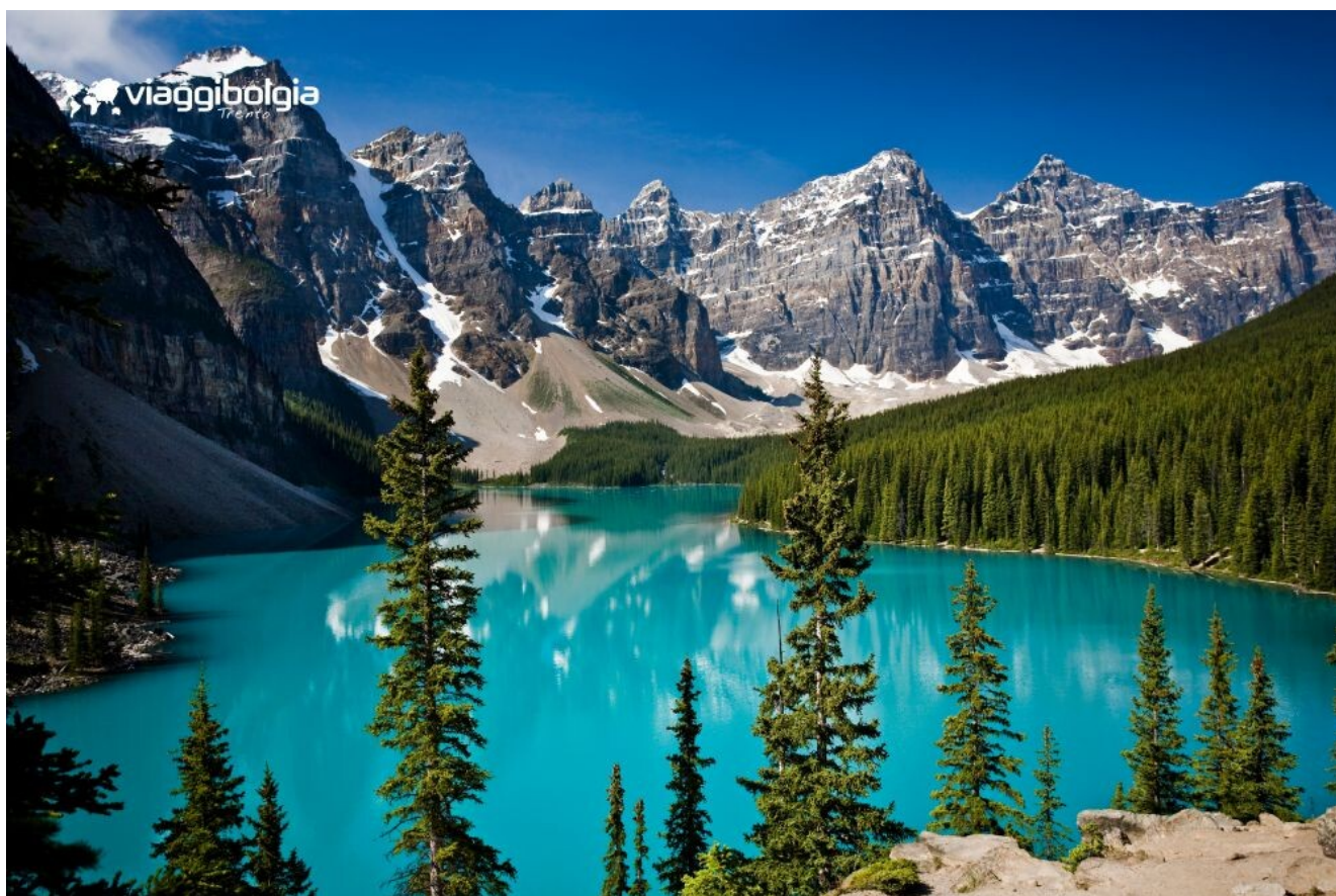
Il Lago Moraine con le sue acque colorate dalla farina glaciale che offrono uno dei panorami più fotografati delle Montagne Rocciose

Escursione al lago Louise , a 1.750 metri di altitudine, una delle principali attrazioni del Parco Nazionale di Banff . Il lago, alimentato dalle acque di fusione del ghiacciaio Victoria, è noto per il suo colore turchese intenso e per il contesto montano che lo circonda. A seguire visita al lago Moraine , situato nella Valley dei Ten Peaks . L'area offre punti panoramici facilmente accessibili e brevi percorsi naturalistici. Pranzo in corso di escursione. Rientro a Banff e risalita in cabinovia sulla Sulphur Mountain tramite la celebre Banff Gondola . Durante l'ascesa si può ammirare un'ampia veduta che abbraccia sei diverse catene montuose, oltre alla valle del Bow River e alla cittadina di Banff. Cena libera.