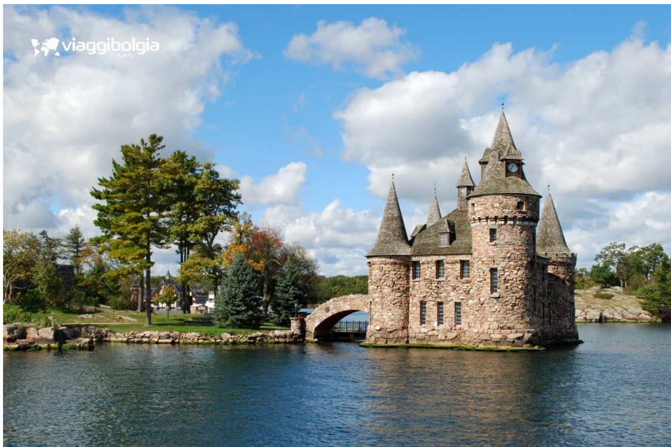
Le Mille Isole del San Lorenzo